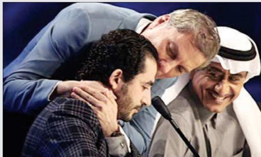
أحمد حلمي يابكياً ولجنة التحكيم تحاول تهدئته