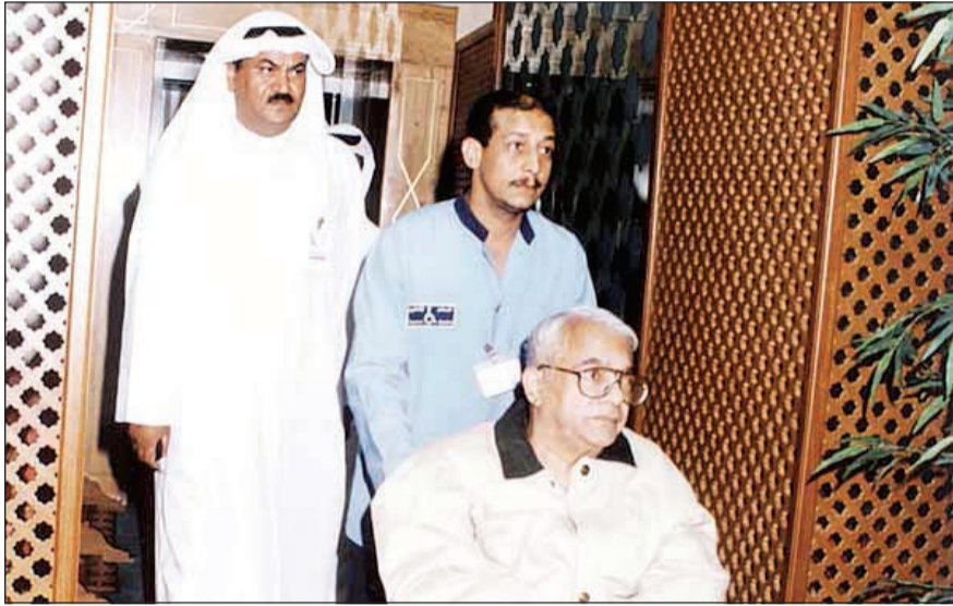
..وإثناء عودته من رحلة علاجه قبل وفاته