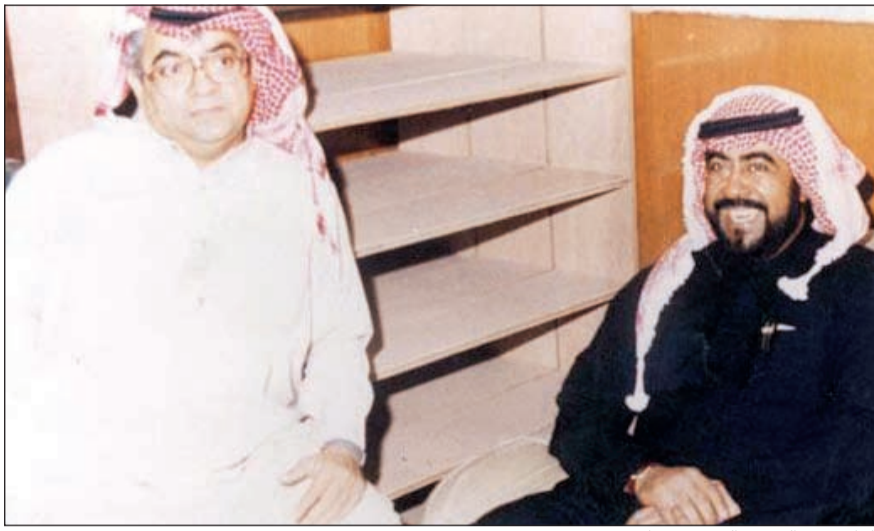
الراحل مع الشهيد الشيخ فهد الاحمد