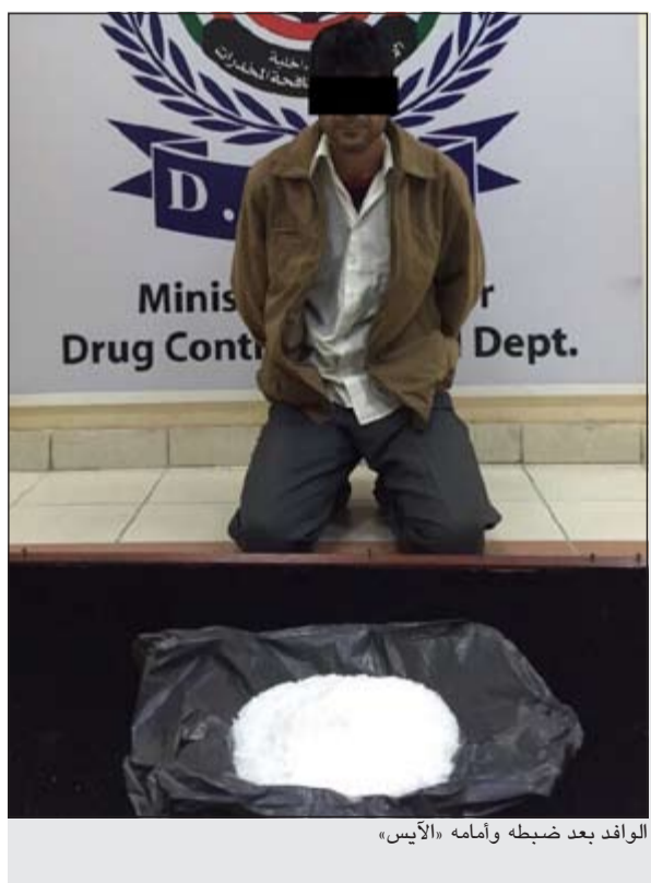
الوافد بعد ضبطه وأمامه «الأيس»

من جهته، قال مدير الجمرک البري عدنان القضيبى ان رجال الجمرک البري هم العين الساهرة على الوطن والمواطن في المنافذ البرية وهم يقدمون الكثير من أجل صد كل من يحاول تهريب المتوعات.