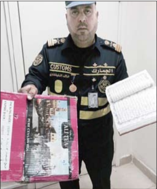
المصاحف المضبوطة أحبلت إلى «الإعلام»