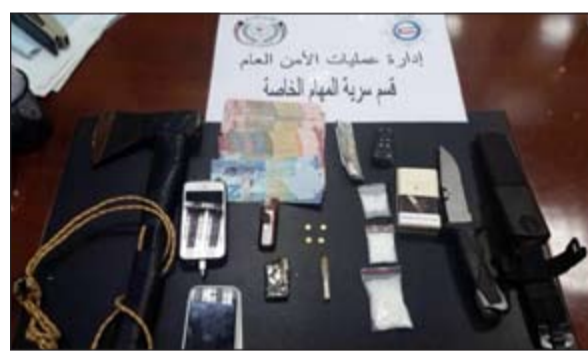
جانِب من مضبوطات سرية المهام

الى التنفيذ الجنائي بعد ان تم العثور بحوزته على مواد مخدرة، وقال مصدر أمسي انه خلال قيام رجال الأمن بنقطة أمنية روتينية لحفظ الأمن، تم الاستعلام عن مواطن كان يغير الرتبة، وتبين انه مطلوب بحسب جنائي 9 شهور تعاطي مخدرات، وكذلك مدين بمبلغ 8 آلاف دينار وعند تفتيشه احترازياً ضبط بحوزته على اصبع اشتباه سواد مخدرة (حشيش) وكذلك 3 اطرف كاملة اشتباه مادة شبو المخدرة، وكذلك على 4 حبات كيتي وتمت إحالته لمكافحة المخدرات.