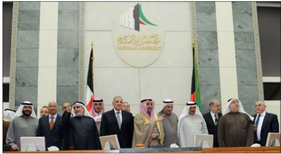
الرئيس الغانم والنواب ورئيس الوزراء المصري وأعضاء الوفد في قاعة عبدالله السالم

استقبل رئيس مجلس الأمة مرزوق الغانم في مكتبه أمس الأحد رئيس وزراء جمهورية مصر العربية ابراهيم محلب والوفد المرافق له وذلك بمناسبة زيارته البلاد. وجرى خلال اللقاء التأكيد على الروابط الأخوية التي تربط البلدين والشعبين الشقيقين وتعزيز آفاق التعاون بينهما، كما تطرق اللقاء إلى آخر المستجدات على الساحتين الإقليمية والدولية. وشدد الطرفان على أهمية مواجهة التحديات التي تعصف بالمنطقة وبذل المساعي للتصدي لها كما اتفق الطرفان على توحيد الجهود للتصدي للإرهاب ومكافحته. كما أكد الغانم مساندة الكويت برلماناً وشعباً لجمهورية مصر العربية في كل ما من شأنه