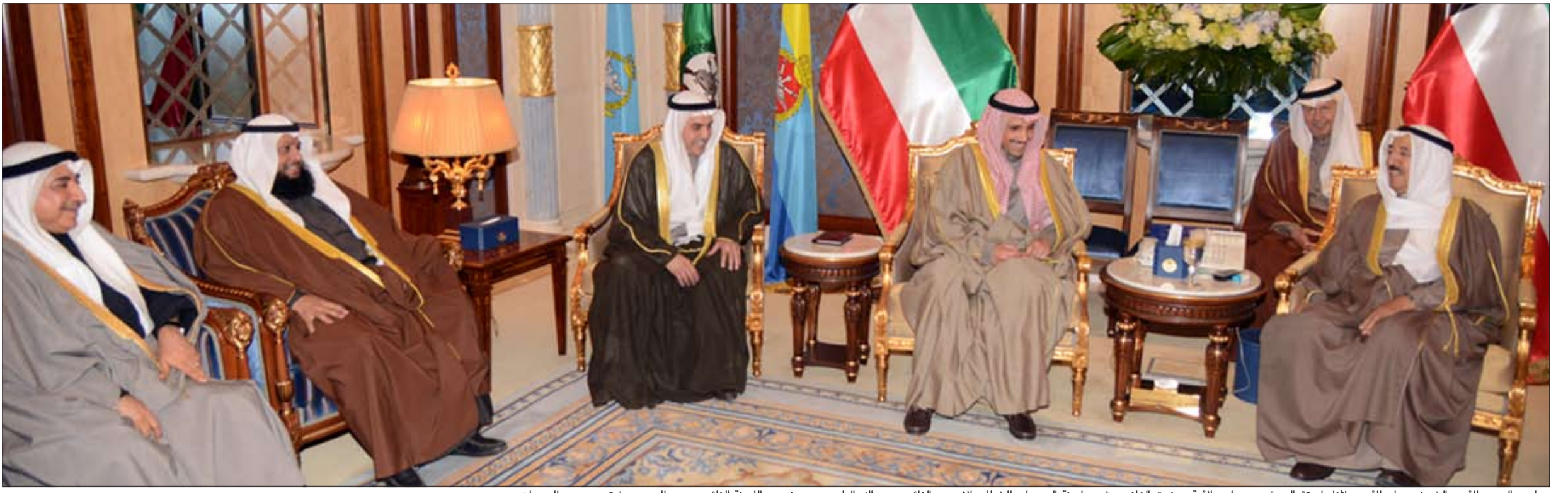
صاحب السمو الامير الشيخ صباح الاحمد اثناء استقباله رئيس مجلس الأمة مرزوق الغانم ورئيس لجنة الرد على الخطاب الاميري النائب د.عبدالله الطريجي وعضوي اللجنة النائبين د.عبدالحاميد دشتي وحمود الحمدان

صاحب السمو استقبل رئيس مجلس الأمة وأعضاء لجنة الرد على الخطاب الأميري