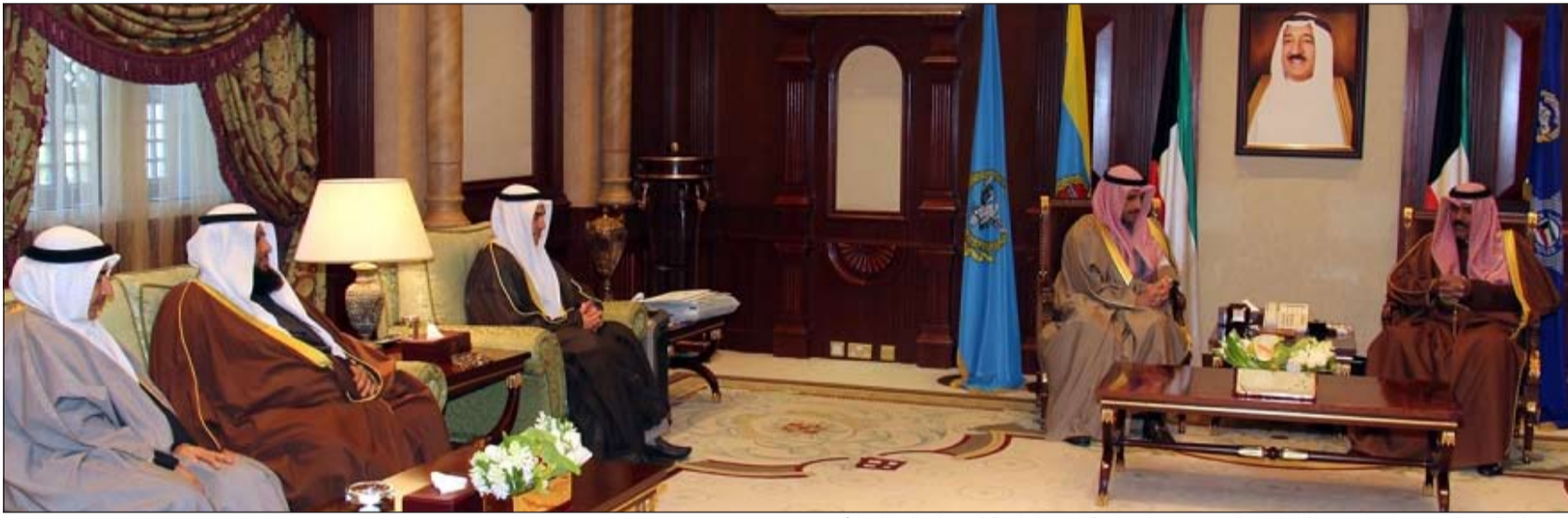
سمو ولي العهد الشيخ نواف الاحمد اثناء استقباله رئيس مجلس الأمة وأعضاء لجنة الرد على الخطاب الأميري

استقبل صاحب السمو الأمير الشيخ صباح الأحمد، حفظه الله ورعاه، بقصر بيان صباح أمس رئيس مجلس الأمة مرزوق الغانم ورئيس لجنة مشروع الجواب على الخطاب الأميري النائب د.عبدالله الطريجي وعضوي اللجنة النائبين حمود الحمدان والنائب د.عبدالحاميد دشتي حيث رفعوا إلى سموه تقرير لجنة مشروع الجواب على الخطاب الأميري لدور الانعقاد العادي الثالث للفصل التشريعي الرابع عشر. وزودهم سموه بتوجيهاته السامية لبذل مزيد من الجهود لتحقيق ما يصبو إليه المواطنون من آمال وتطلعات لدعم وتعزيز مسيرة التنمية في البلاد من خلال التعاون المشترك بين السلطتين التشريعية والتنفيذية لما فيه مصلحة الوطن العزيز. وأكد رئيس مجلس الأمة مرزوق الغانم أنهم سيكثرون عند حسن ظن سموه، حفظه الله، نحو العمل الجاد والمستمر والعمل على تحقيق الرغبة السامية لما فيه خير الوطن والمواطن. كما استقبل سمو ولي العهد الشيخ نواف الأحمد بقصر بيان صباح أمس رئيس مجلس الأمة مرزوق الغانم وأعضاء لجنة مشروع الجواب على الخطاب الأميري لدور الانعقاد العادي الثالث للفصل التشريعي الرابع عشر. حيث رفعوا إلى سموه تقرير لجنة مشروع الجواب على الخطاب الأميري لدور الانعقاد العادي الثالث للفصل التشريعي الرابع عشر.