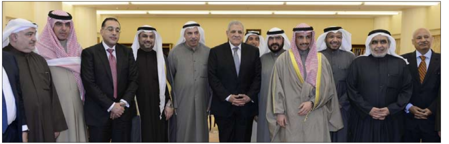
رئيس مجلس الأمة مرزوق الغانم متوسماً رئيس مجلس الوزراء المصري ابراهيم محلب وعدداً من النواب

الزمانان. وضع الوفد المصري كلا من محافظ البنك المركزي المصري هشام رامز، ووزير البترول والثروة المعدنية م.شريف اسماعيل محمد، ووزير الإسكان والمرافق والمجمعات العمرانية د.مصطفى كمال مديولي، ووزير الاستثمار أشرف عبدالقادر سلمان، وسفير جمهورية مصر لدى الكويت عبدالكريم سليمان، والمتحدث الرسمي باسم رئاسة مجلس الوزراء السفير حسام القاويش، ورئيس الإدارة المركزية للإعلام برئاسة مجلس الوزراء طارق كمال، والمستشار الإعلامي برئاسة مجلس الوزراء هاني يونس، ورئيس مجلس إدارة شركة المقاولون العرب م.محمد محسن صلاح الدين.