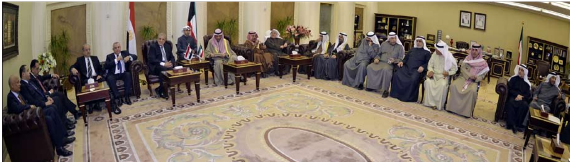
جانب من جلسة المباحثات الكويتية- المصرية في مكتب رئيس مجلس الأمة مرزوق الغانم