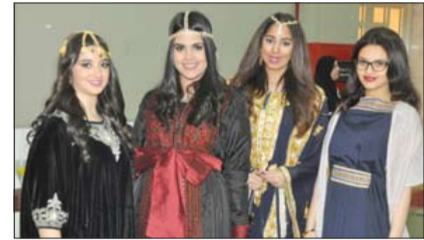
عدد من الطالبات يشاركن في الحملة