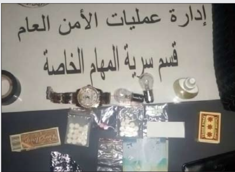
أظرف شبو وأدوات تعاط ضبطت بحوزة أحد المتعاطين