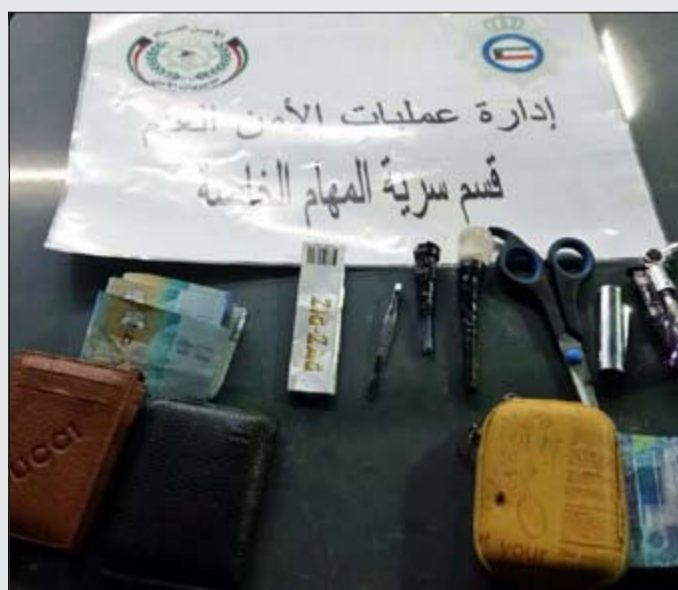
كمية الحشيش المضبوطة بحوزة السوري والخليجي بمنطقة سلوي