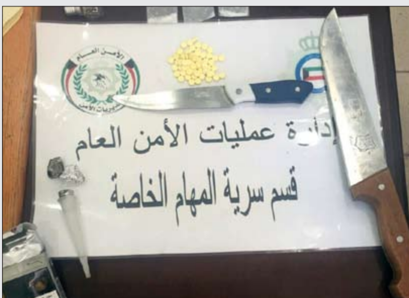
سكاكين ضبطت بحوزة المتهمين

شنّ رجال أمن مبارك الكبير بتعليمات من الوكيل المساعد لشؤون الأمن العام اللواء عبدالفتاح العلي وتنفيذ العميد نافع العنزري وإشراف مدير العمليات والدوريات المقدم نايف الحجرف حملة على المركبات العملاقة التي