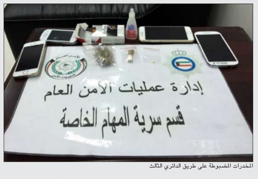
المخدرات المضبوطة على طريق الدائري الثالث