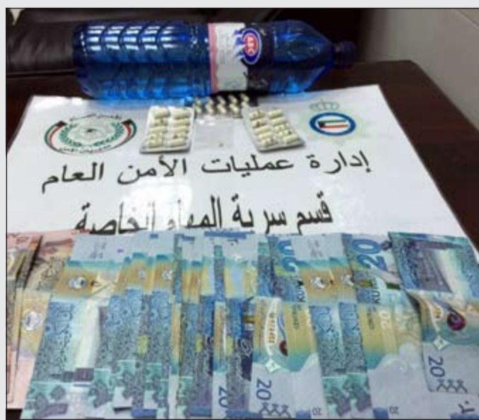
الحبوب المخدرة المضبوطة في منطقة جنوب السرعة