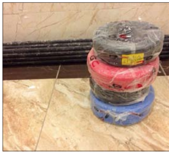
اسلاك كهربائية ضبطت بحوزة اللص في منطقة جابر الأحمد