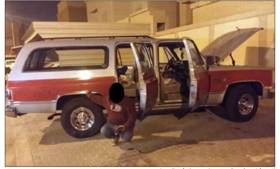
المتهم امام مركبته التي فر بها من رجال أمن الجهراء

وأبرزت إدارة الإعلام الأمني أن الواقعة برمتها تتعلق بقضية عدم الامتثال لأوامر نقطة التفتيش بالتوقف، بالإضافة إلى حيازة المخدرات والتشبه بالجنس الآخر ولا علاقة لها بأي شيء آخر.