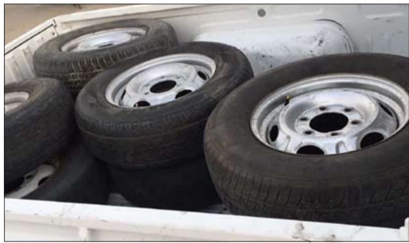
إطارات يعتقد أنها مسروقة ضبطت خلال الحملة