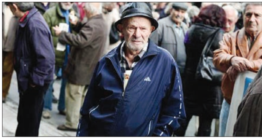
مواطن يوناني ويبدو مستاء من حالة التشفيف التي تشهدها اليونان منذ ثلاث سنوات