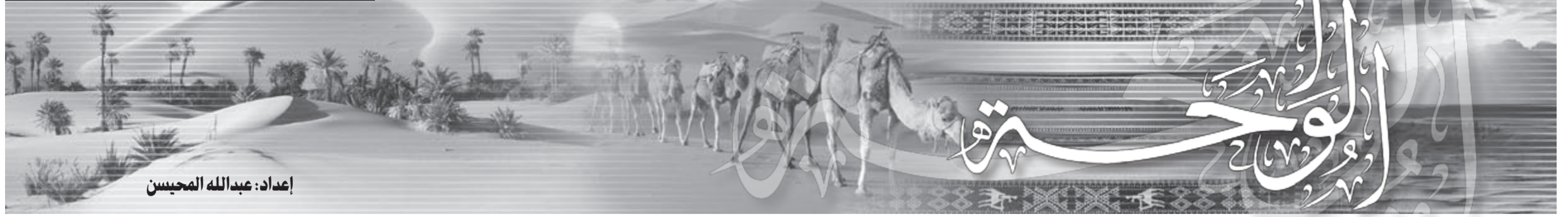
إعداد: عبدالله المحيسن