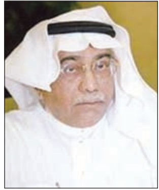
الشاعر الراحل محمد اسماعيل جوهرجي