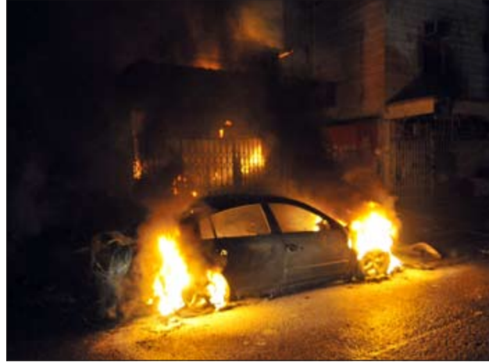
التيران تشتعل في مركبة متوقفة أمام المنزل قبل إخماد الحريق