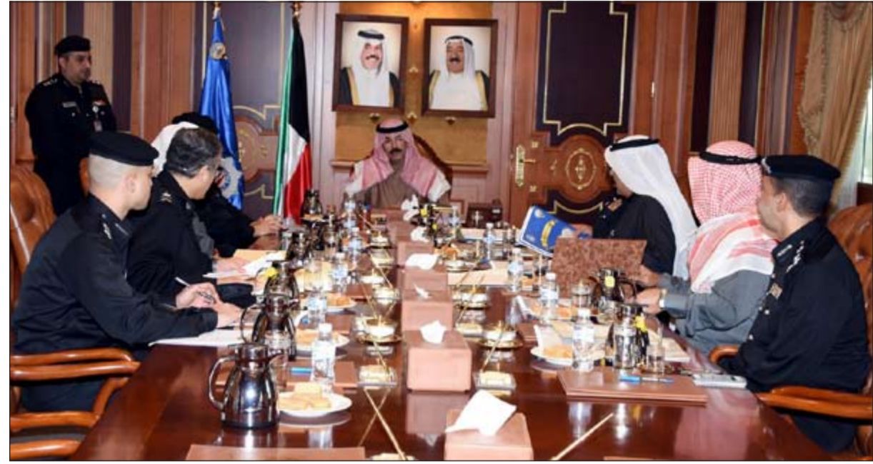
الشيخ محمد الخالد مترسدا اجتماع مناقشة الخطط والاستعدادات لتنفيذ قانون جمع الأسلحة

التفتيش مراعاة للعادات والتقاليد المجتمعية. وبين أن القانون يعفي الأشخاص من العقوبات في حال تسليم ما لديهم من أسلحة وذخائر ومفرقات طوعية خلال مرحلة التمهيد ومدتها أربعة أشهر وذلك للتعريف بالقانون والإجراءات والعقوبات المنصوص عليها،