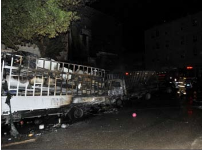
الحريق تسبب في إتلاف 4 مركبات