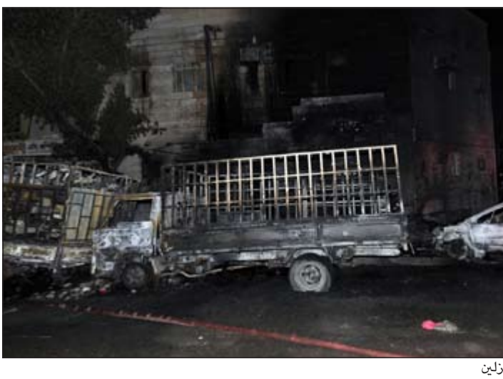
آثار الحريق على المنزلين

عبدالله قبيص - محمد الدبيش كتبت النجاة لسكان منزلين في الجليب بعد أن أتت النيران عليهما بالكامل بالإضافة إلى إتلاف 4 مركبات دون أن يعرف سبب الحريق الذي اقتصرت أضراره على الخسائر المادية، ووفق مصدر إطفائي فإن بلاغا ورد إلى غرفة العمليات في تمام الساعة 2:31 من فجر أمس يقيد بوقوع حريق في منزل بالجليب مقابل ستاد جابر، وعلى الفور تحرك مركز إطفاء الجليب بقيادة