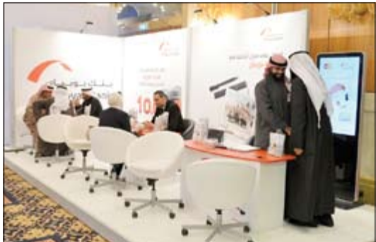
من حملات البنك السابقة

قام البنك بطرحه مؤخرا كما ستتاح الفرصة لجميع زوار سعي البنك لمخ عملائه فرصة للدخول الي سحب لربح جهاز iPhone 6. يذكر ان البنك وانطلاقا من حرصه على تقديم أفضل المنتجات التمويلية المتوافقة مع أحكام الشريعة الإسلامية السمحة أعلن مؤخرا عن إطلاق منتج القرض الحسن لعملائه وعملاء البنوك الأخرى بنسبة أرباح (0٪) وبفترة سداد تصل