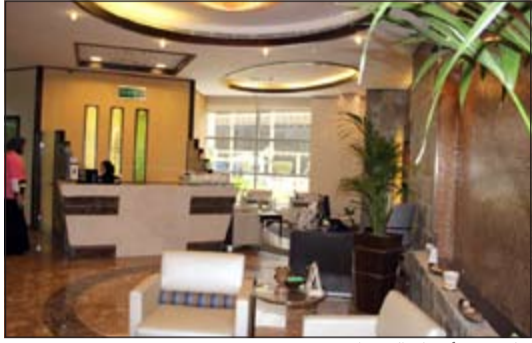
جانب من أقسام السيدات في «بيتك»

والأحمدي والشويخ، حيث تتميز الفروع كافة بالكفاءة في الأداء وتوفير جو من الخصوصية للسيدات يساعدن على استكمال