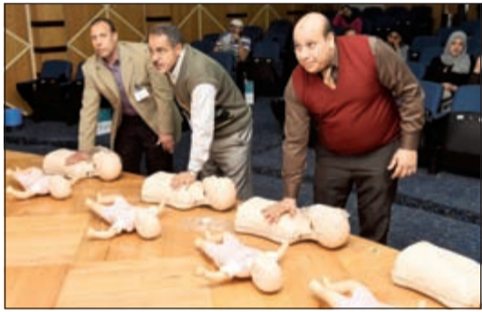
موظفو البنك خلال الدورة

من الحالات الطارئة التي يمكن أن يواجهها الطلبة في المدرسة.