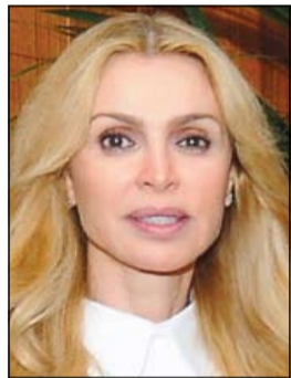
الشخبة ريما الصباح

في الشرق الأوسط». من جانبها، عبرت الشخبة ريما الصباح في لـ «كونا» عن فخرها بهذا الاختيار من خلال هذه المنظمة «التي طلما كانت قريبة مني والتي تساعد الملايين حول العالم الذين يتأثرون بالحروب الذين يتأثرون باللاجئين ان دورها كسفيرة للنوايا الحسنة سيكون تجاه زيادة الوعي وتشجيع الدعم للاجئين السوريين في البلدان المجاورة، وشدت على حرص الكويت على دعم المبادرات الإنسانية حول العالم واستمرار مساندتها لمنظمات الأمم المتحدة المختلفة وخصوصا مفوضية شؤون اللاجئين، مشيرة الى استضافة الكويت لمؤتمرين للمناحين لسورية والثالث قريبا.