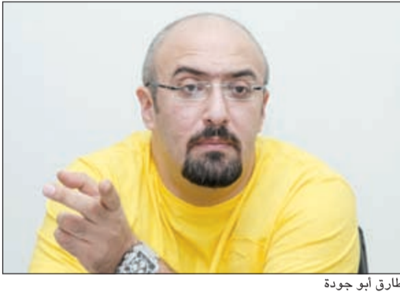
طارق أبو جودة

الذي من المفترض أن يكون ضخماً وعلى قدر التوقعات التي ينتظرها الجمهور من التعاون مع مخرج يختلف برؤيته في أعماله عن باقي مخرجي الكليبات.