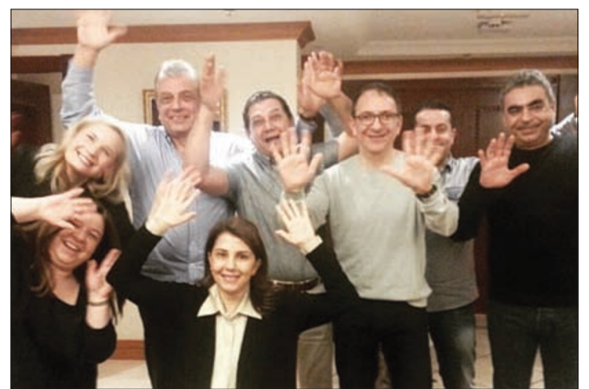
ماجدة الرومي تحفل بعيد ميلاد شقيقها عوض الرومي

بيروت - ندى مفرخ سعيد افتتحت الفنانة ماجدة الرومي مسرح المجاز في الشارقة في حفل فني لها الاثني الماضي، عاد ريعه لحملة القلب الكبير المخصصة للأطفال المحتاجين حول العالم والتي تعني بحمايتهم وتأمين مستقبل أفضل لهم وذلك وسط حضور جماهيري فاق الـ 3 آلاف شخص.