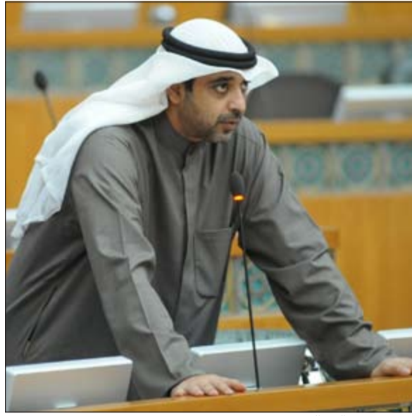
الشيخ محمد العبدالله