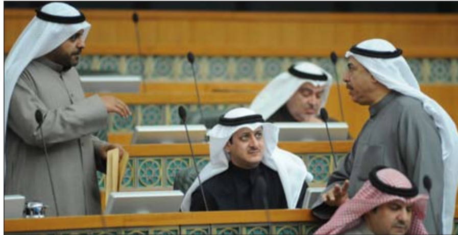
جانب من الجلسة

● مرقوق الغانم: شكرا لكل من تحدث مؤبنا الراحل الملك عبدالله والعديد منكم كان يود الحديث ليستذكر مناقب الفقيه، فساعتان لن تكفي لتوفيه إنجازاته، فهو رجل يكن له الكويتيون محبة خاصة، فقد كنت حاضراً بيننا كويتيين عرب ومسلمين، وإن كنت رحلت بجسدك الفاني حاضراً بما قدمته لحجاج بيت الله الحرام، ويبقى عزاًؤنا بوجود خلفه الملك سلمان الذي سيسلك درب العطاء،