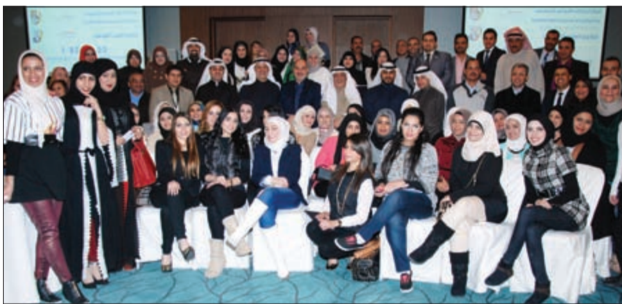
لقطة تذكارية للمشاركين بالدورة التدريبية