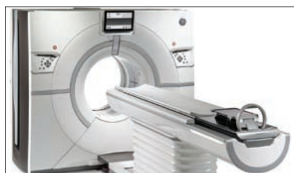
أحد الأجهزة الحديثة التي تزود بها «جنرال إلكترو» المستشفيات

كما سيمت تجهيز «مركز الشيخ صباح الأحمد للمسالك البولية»، وهو الأول من نوعه في الكويت بقدرته استيعابية تبلغ 100 سرير - تقنيات «جنرال إلكترو» للرعاية الصحية»، ومنها أنظمة التصوير بالرنين المغناطيسي Optima MR450w الذي يمنح المريض تجربة مريحة بفضل اتساع المنطقة المخصصة لتصوير المريض مقارنة مع أجهزة التصوير التقليدية. كما سيتم تجهيز «مستشفى الرازي للعظام» بمجموعة من أحدث حلول التصوير الشعاعي الرقمي بالأشعة السينية من «جنرال إلكترو». ومن المقرر افتتاح المستشفى في عام 2015، حيث سيقدّم العلاج لأطراف الجسم مثل الأيدي والأقدام.