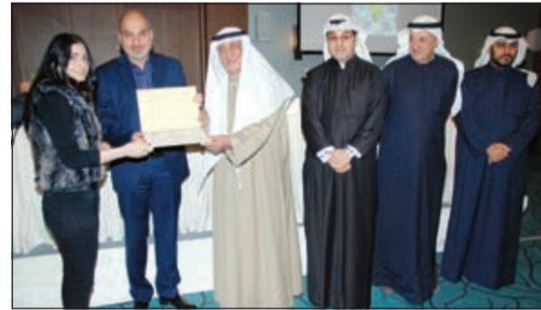
شهادة لإحدى المشاركات