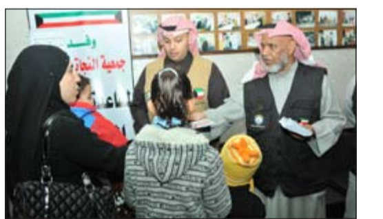
مراعاة النازحين واجب إنساني وديني