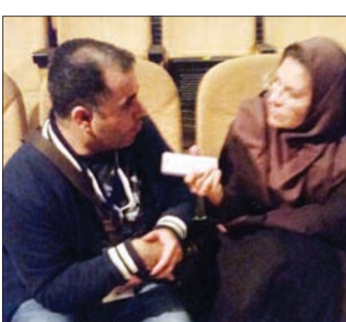
الصحافة الإيرانية حرصت على إجراء المقابلات مع النصار