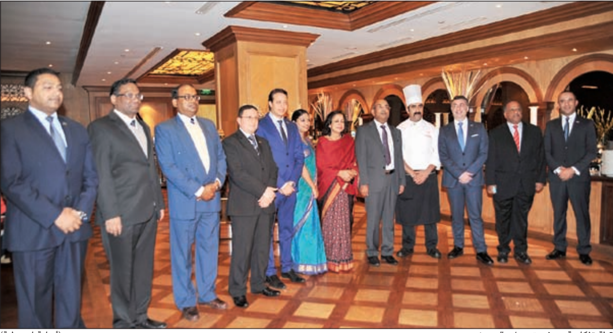
لقطة تذكارية مع فريق عمل «الريجنسي» (إسامة ابوعطية)