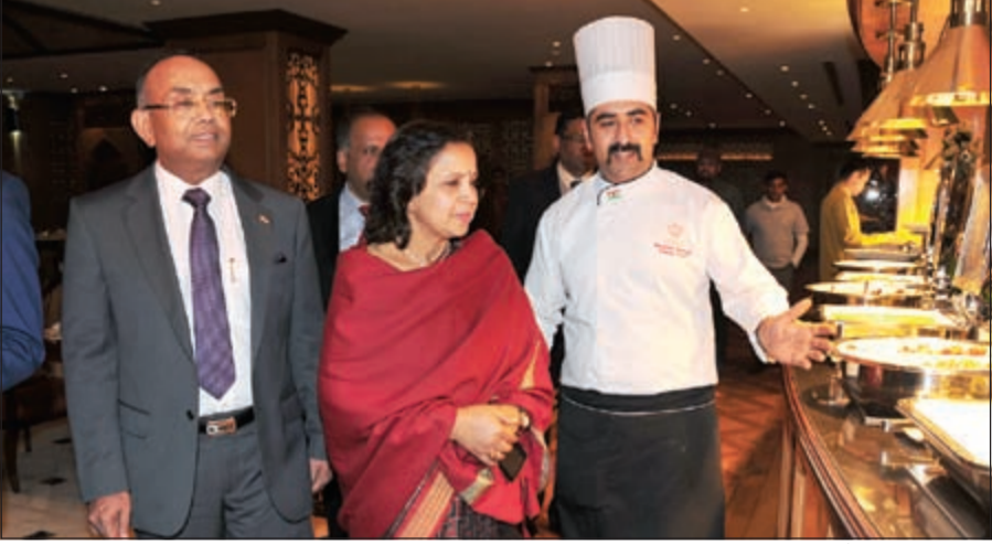
جولة على يوفيه أشهى الأطباق الهندية