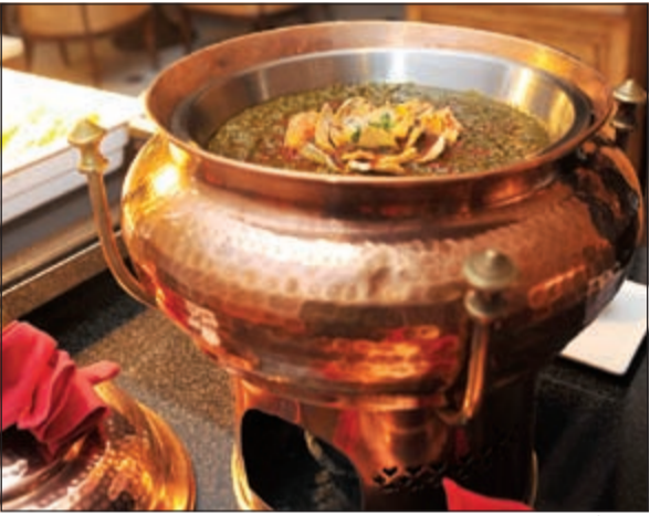
من المأكولات الهندية