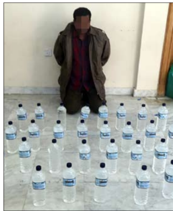
الآسيوي بعد ضبطه عقب محاولته الهرب وأمامه المضبوطات

تقدم مدير بوزارة الاعلام ببلاغ اتهم فيه شخصا مجهول الهوية بانتحال صفته الوظيفية واسمه وكذلك صورته وتدشين حساب على