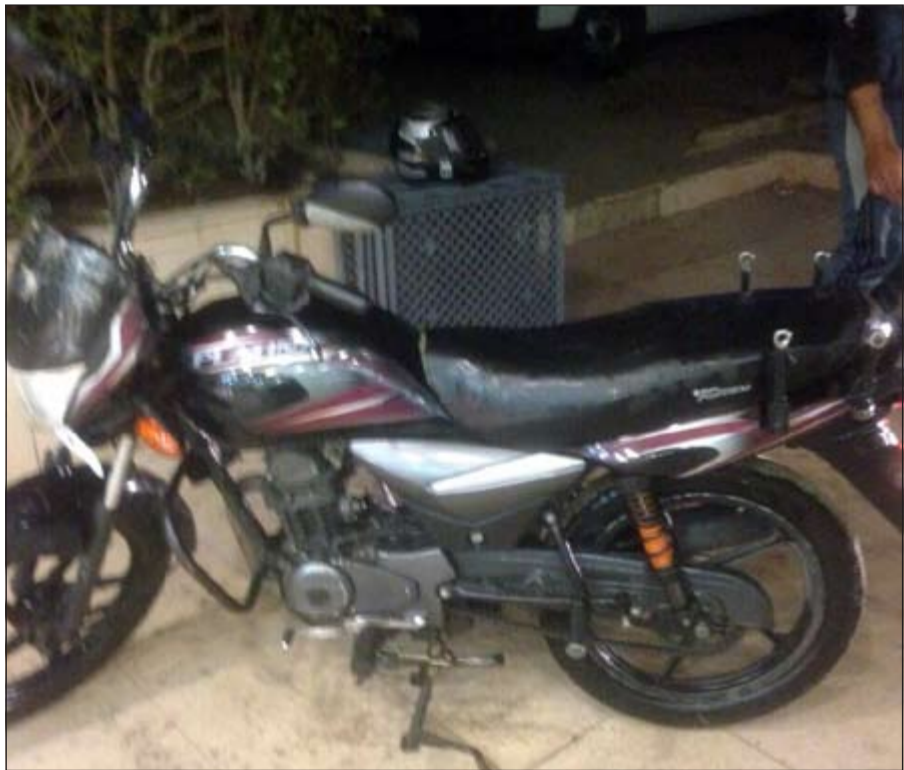
درجات نارية أحيلت إلى كراج الحجز في حملة العاصمة