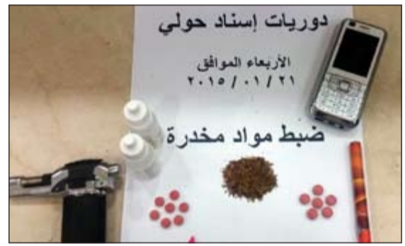
من مضبوطات امن حولي