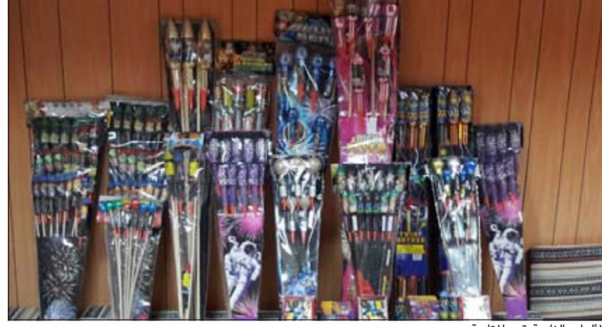
الالعاب النارية قيد المتابعة