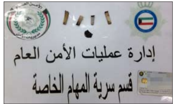
الحشيش وبقايا السجائر المضبوطة في ابو حليفة