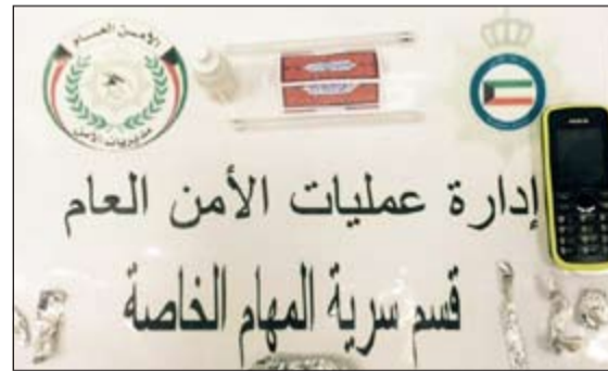
لفافات القصدير المحشوة بالشبو