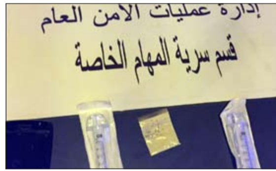
مواد مخدرة مضبوطة في الاحمدي