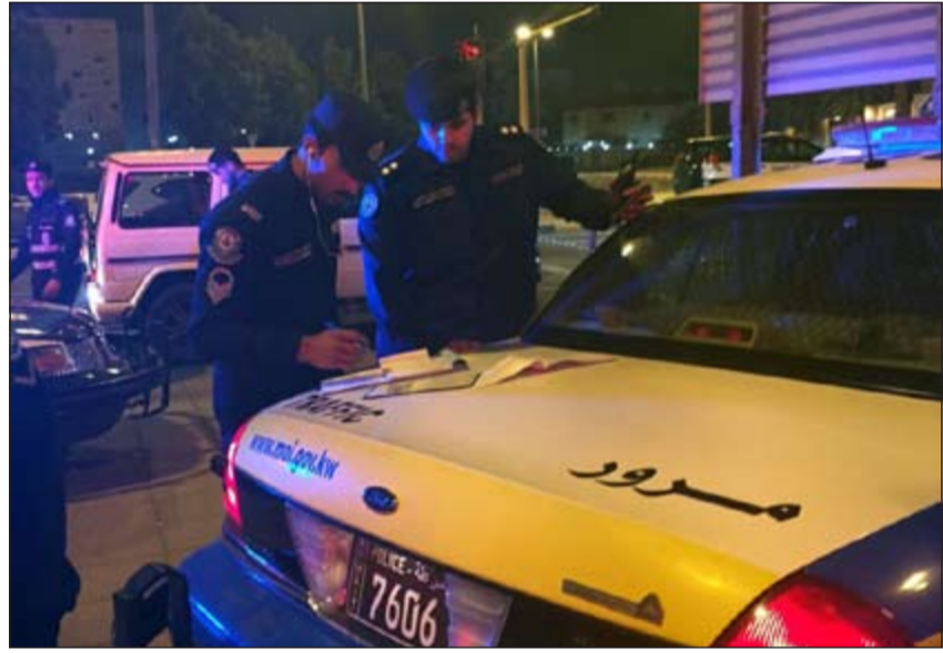
تحرير رجال المرور لعدد من المخالفات في إحدى نقاط التفتيش