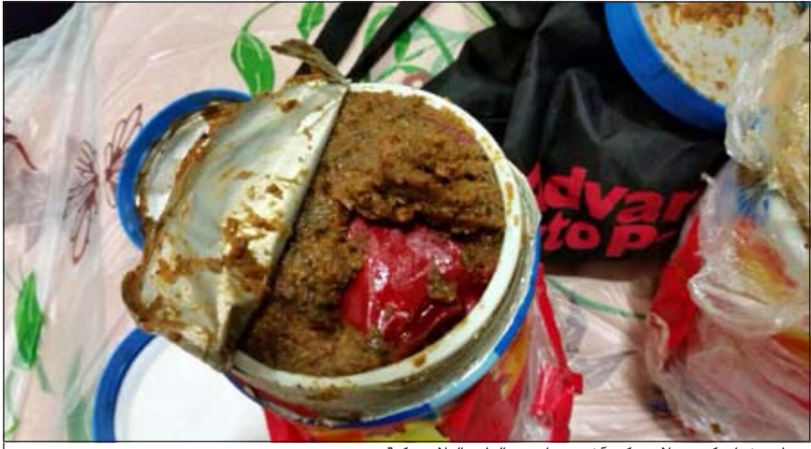
.. واستخراج كيس بلاستيكي آخر من إحدى ألعاب البلاستيكية