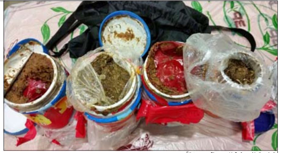
اللعاب البلاستيكية المضبوطة بحوزة الأسوي