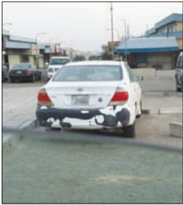
السيارة المشبوهة كما رصدت في صناعة الجهراء

علب لحوم مفرومة بطريقة مبتكرة، غير أن فطنة المفتشة قادت إلى إحباط محاولة التهريب تلك والتي تعد الأكبر هذا الشهر. وقال مصدر أمني: إن المفتشة اشتبهت في المسافر أثناء قيامه بإنهاء إجراءات دخوله إلى البلاد،