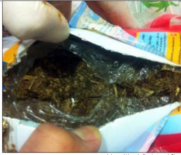
لحظة استخراج اكياس الماريغوانا