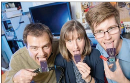
الجهاز مع 3 بعد تجربته

كولورادو - وكالات: ابتكر الباحثون في جامعة ولاية كولورادو طريقة يمكن أن تساعد نسبة كبيرة من الناس، الذين لا يستطيعون الحصول على زرع قوقعة الأذن، واستعادة شكل ما من أشكال السمع.