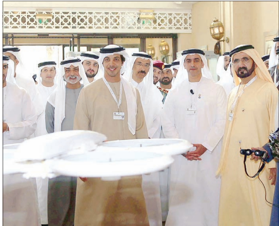
الشيخ محمد بن راشد آل مكتوم نائب رئيس الدولة رئيس مجلس الوزراء حاكم دبي أثناء الاحتفال بالجائزة

المشاركات النوعية، ما يؤكد نجاحها في تعزيز جهود الابتكار حول العالم لاستخدام التكنولوجيا في إسهام البشرية وتسهيل حياة الناس في مختلف القطاعات، لتصبح بذلك جائزة عالمية رائدة ومجسدة لرؤية حكومة دولة الإمارات في التوظيف الأمثل للتقنيات الحديثة بما يخدم المجتمع الإنساني ويحقق السعادة للمتعاملين.