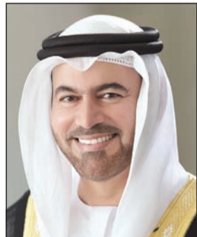
وزير شؤون مجلس الوزراء محمد القرقاوي

دبي - خاص: استقطبت «جائزة الإمارات للطائرات بدون طيار لخدمة الإنسان» التي أطلقها صاحب السمو الشيخ محمد بن راشد آل مكتوم نائب رئيس الدولة رئيس مجلس الوزراء حاكم دبي خلال القمة الحكومية