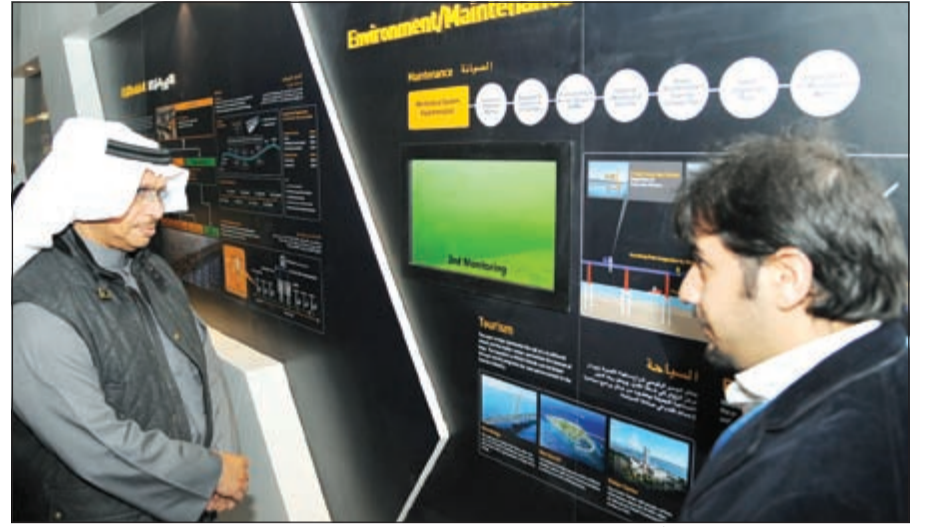
سمو الشيخ جابر المبارك متفقدآ آلية العمل في جسر جابر

افتتح مبنى الزوار المؤقت والمركز الإعلامي واستمع إلى شرح مفصل عن سير العمل في المشروع وما تم إنجازه من مراحل تجاوزت 26٪