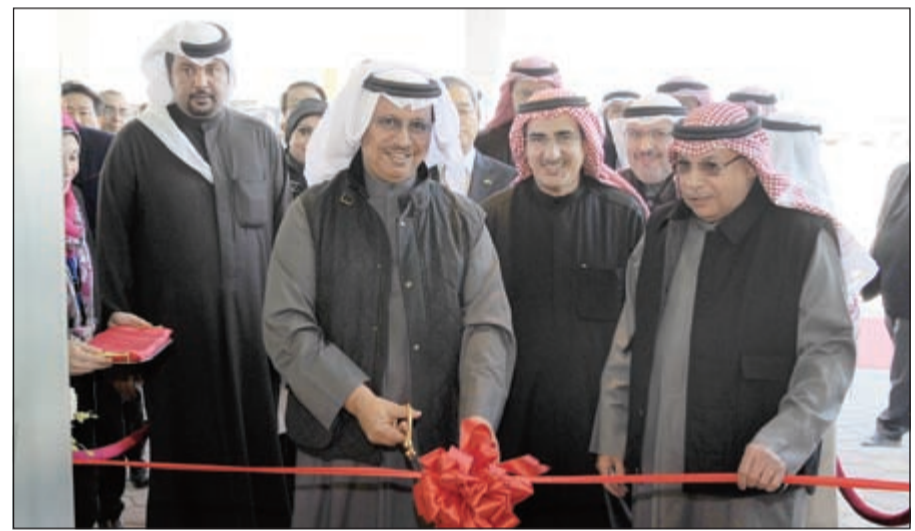
سمو رئيس مجلس الوزراء الشيخ جابر المبارك يفتتح مبنى الزوار المؤقت

(أمس) ونحن نعيش أياماً تاريخية عزيزة على قلوبنا بمرور 9 أعوام على تقلد صاحب السمو الأمير الشيخ صباح الأحمد، حفظه الله ورعا، مقاليد الحكم، بتفقد أحد المشاريع الحيوية والمهمة وهو ضمن المخطط الهيكلي للدولة ولا شك أن المشروع الذي يحمل اسم المغفور له الشيخ جابر الأحمد، سيكون مشروعاً مميزاً بكل تفاصيله ومكوناته». ولا يسعنا ونحن نرى هذا الصرح الجديد إلا أن نشيد بدور أبناء الكويت من المهندسين والفنيين في خدمة وطنهم ونثمن عطاءهم الواضح في إنجاز المشروع وهو ما عهدناه دوماً في أبنائنا. هذا، وصرح وزير الأشغال