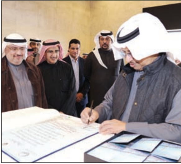
سمو رئيس الوزراء يسجل كلمة في سجل كبار الزوار