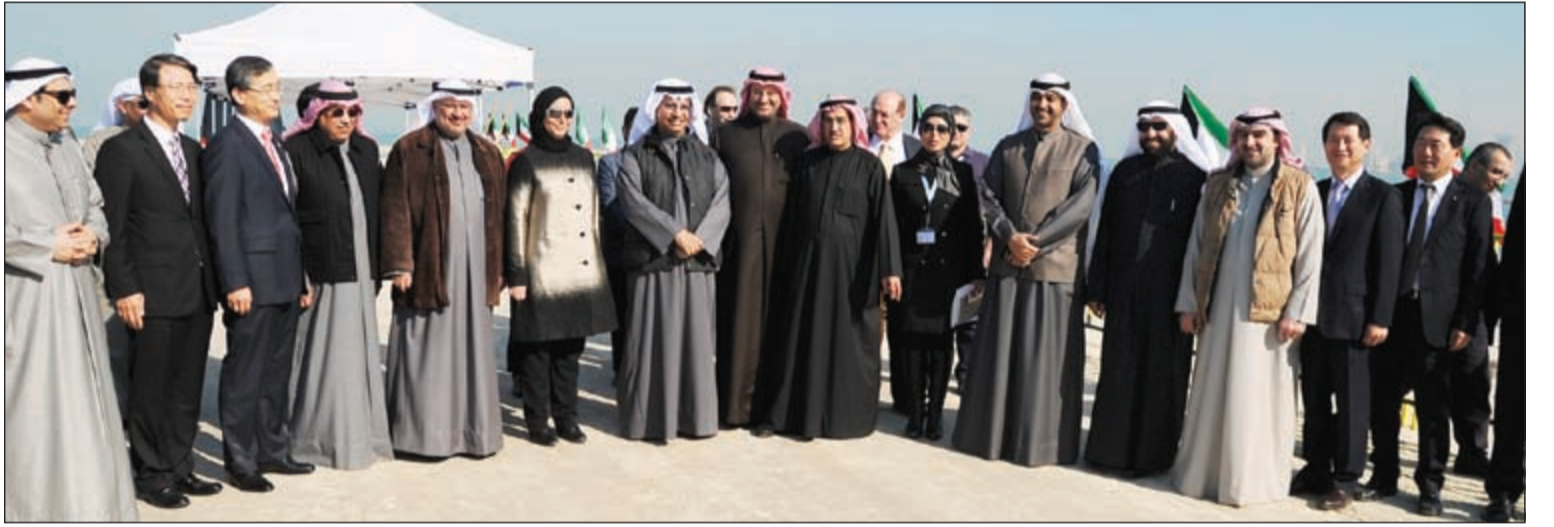
سمو الشيخ جابر المبارك والشيخ خالد الجراح وم. عبدالعزيز الإبراهيم ود.علي العمير وياسر أبل والشيخ محمد العبدالله ود. علي العبيدي في موقع المشروع

المسافة ما بين مدينة الكويت ومدينة الصبية من 104 كم (حوالي 90 دقيقة) إلى فقط 36 كم (أقل من 30 دقيقة) وسيوفر طريقاً إستراتيجياً جديداً يدعم خطط التنمية المستقبلية بالمنطقة الشمالية لمدينة الكويت. ويبدأ المشروع من تقاطع طريق الغزالي السريع مع شارع جمال عبدالناصر عند ميناء الشويخ حتى طريق الصبية السريع إلى مدينة الصبية الجديدة. رافق سموه في جولته نائب رئيس مجلس الوزراء ووزير الدفاع الشيخ خالد الجراح وعدد من الوزراء وكبار المسؤولين بديوان سمو رئيس مجلس الوزراء ووزارة الأشغال العامة.