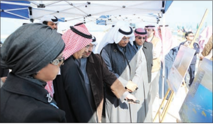
.. وخلال مشاهدة الفيلم التسجيلي عن مراحل المشروع