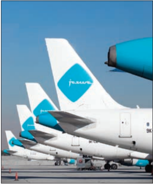
95٪ نسبة التزام «الجزيرة» بمواعيد السفر

أصدرت شركة «طيران الجزيرة» تقرير أداءها التشغيلي لشهر نوفمبر 2014 الذي أظهر أن عدد المسافرين على متن الشركة ارتفع بنسبة 7.7٪ مقارنة بشهر نوفمبر من العام الماضي، وأن الشركة حققت نسبة التزام بمواعيد السفر بلغت 95٪ خلال الشهر.