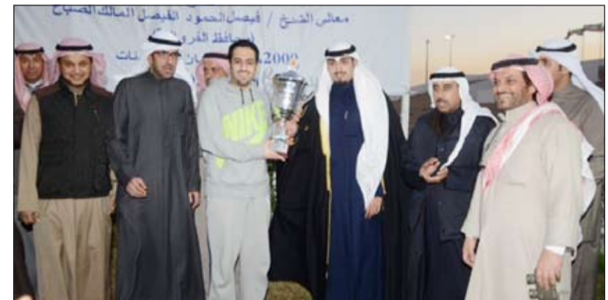
الشيخ ضاري الفهد وتسليم الكأس

وقال ان جميع الأشرطة الـ 6 تميزت بالإثارة والندية مما نالت استحسان وإعجاب الجماهير. وتقدم بجزيل الشكر والامتنان للمبتغين ومنهم الشيخ