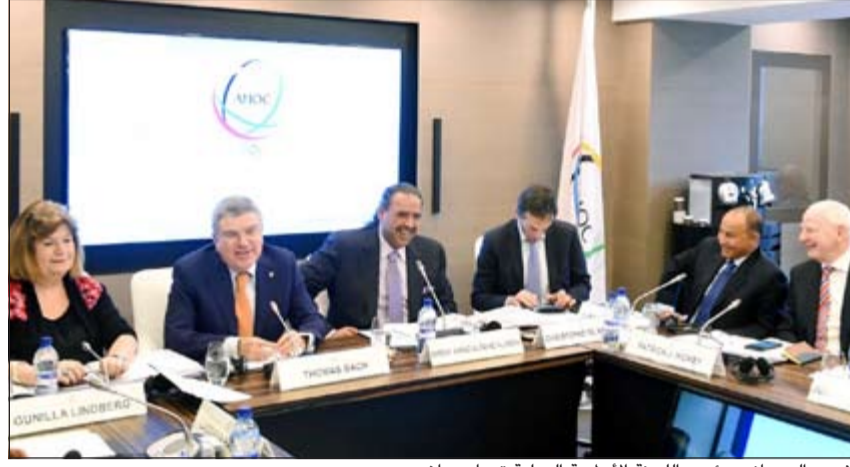
الفهد وإلى جانبه رئيس اللجنة الأولمبية الدولية توماس باخ