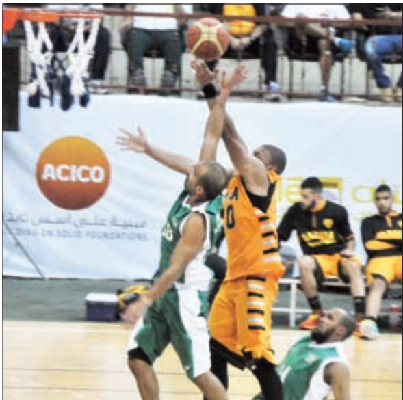
المنافسة ستكون قوية تحت السلة في لقاء العربي والقادسية

وكاظمة برصيد 12 نقطة، ثم النصر 11 نقطة، واليرموك 9 نقاط، والعربي 8 نقاط، والشباب والتضامن والساحل 7 نقاط، وفي المركز الأخير الصليبخات برصيد 6 نقاط بعد تلقيه الهزيمة في 6 مباريات.