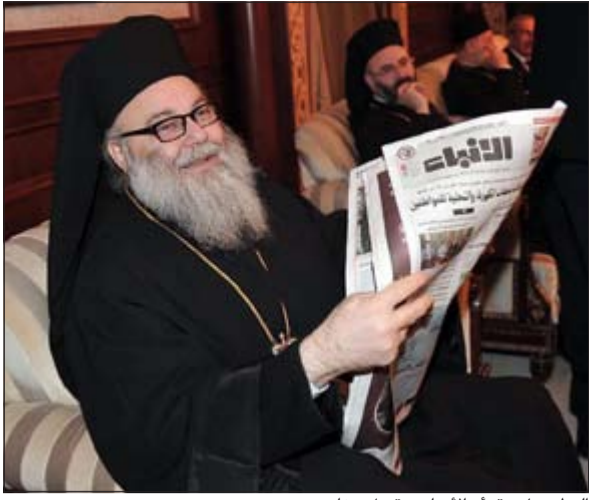
البطريرك يقرأ «الانباء» قبيل مغادرته