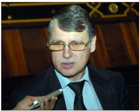
السفير الروسي لدى الكويت الكسي سلوماتين

خاصة إذا أخذنا بعين الاعتبار الأحداث التي تحدث حالياً في أنحاء مختلفة في العالم، فهناك مظاهرات في بعض الدول الأوروبية، وهناك مظاهرات في بعض الدول الإسلامية، وهذه خطوة صحيحة للغاية لإبداء ان هناك حاجة كبيرة في العالم للتعايش الديني وقيم التفاهم على مستوى العالم وما بين الدول والجماعات والديانات المختلفة.