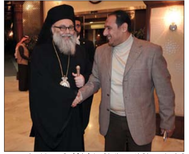
البطريرك يوحنا العاشر مصافحا الزميل أسامة أبو السعود قبل مغادرته

البطريرك اختتم زيارته للبلاد ووجه الشكر للكويت أميرا وحكومة وشعبا