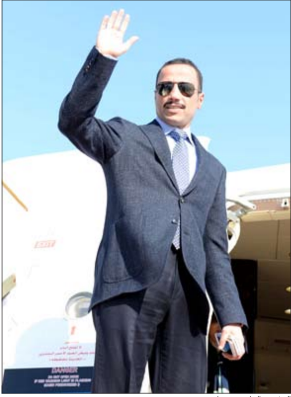
الرئيس الغانم مودعا