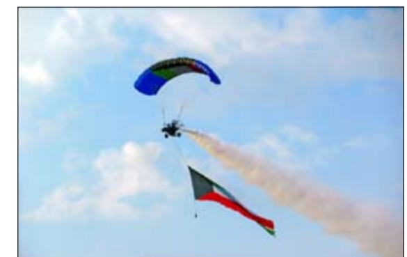
الطائرات الشراعية زينت سماء الكويت

شيثا مبهجا لنفوسنا ان جاء تكريما لاطلاق هيئة الأمم المتحدة هذا اللقب على صاحب السمو الأمير وتسمية على صاحب «مركزا للعمل الانساني»، موضحا ان اختيار المهرجان لشعار «ناقد الإنسانية» أمر يشعرونا بالفخر والاعتزاز. وأشار الى أن الهدف من هذه