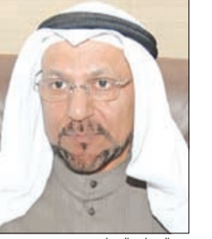
عبد الوهاب الوزان

ثمن وزير التجارة والصناعة الأسبق ونائب رئيس غرفة تجارة وصناعة الكويت عبد الوهاب الوزان الجهود التي يبذلها القائمون على مهرجان هلا فبراير للتسويق 2015 وما يتضمنه من فعاليات ترفيهية وتسويقية وتقنية ورياضية، مشيداً باختيارهم لشعار قائد الإنسانية للمهرجان في دورته السادسة عشرة.