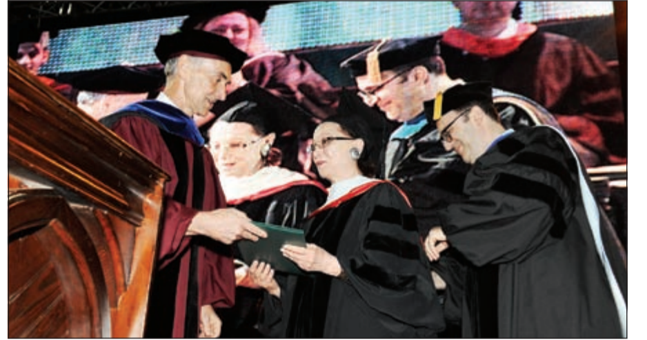
الفنانة فاتن حمامة تتسلم شهادة الدكتوراه الفخرية