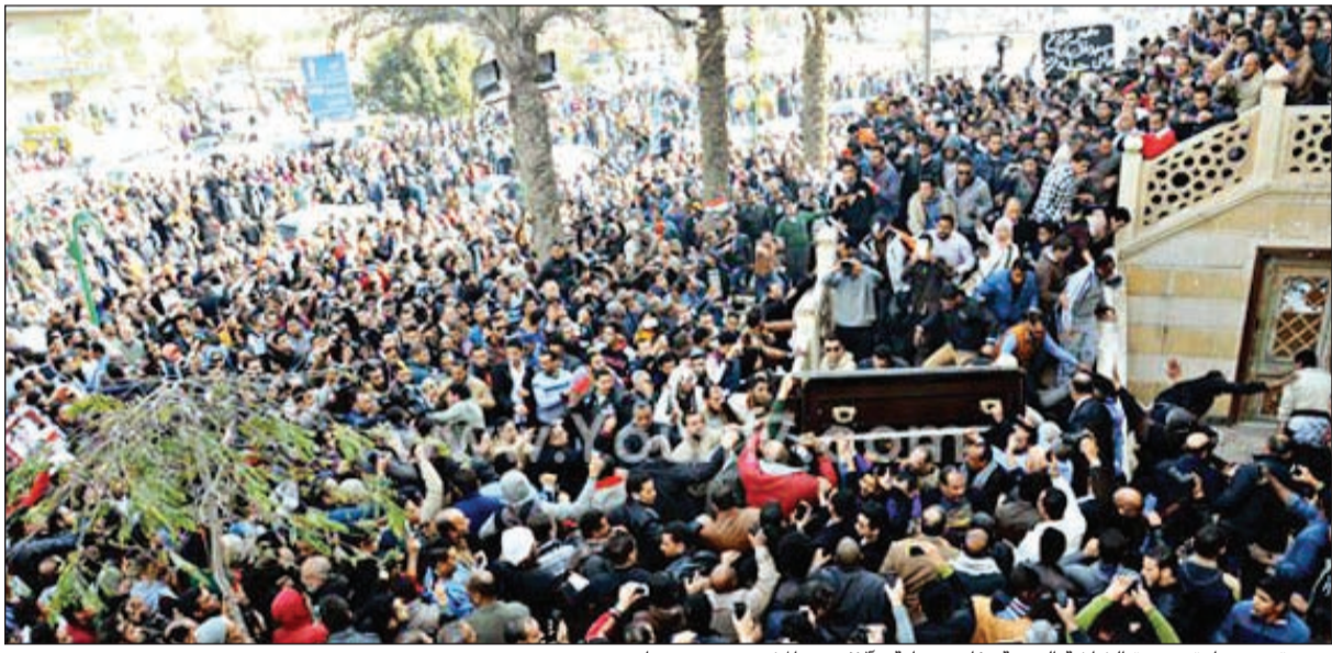
صورة من جنازة «سيدة الشاشة العربية» فاتن حمامة وآلاف من المشيعين يودعونها

وصل إلى القاهرة امس الأحد سفير المغرب لدى مصر محمد سعد العلمي قادما من بلاده على متن طائرة خاصة، حيث شارك في جنازة الفنانة الراحلة فاتن حمامة، وتقديم خالص العزاء لأسرتها من ملك المغرب الملك محمد السادس. وذكرت وكالة أنباء الشرق الأوسط نقلا عن مصادر مسؤولة من السفارة المغربية، أن ملك المغرب أمر