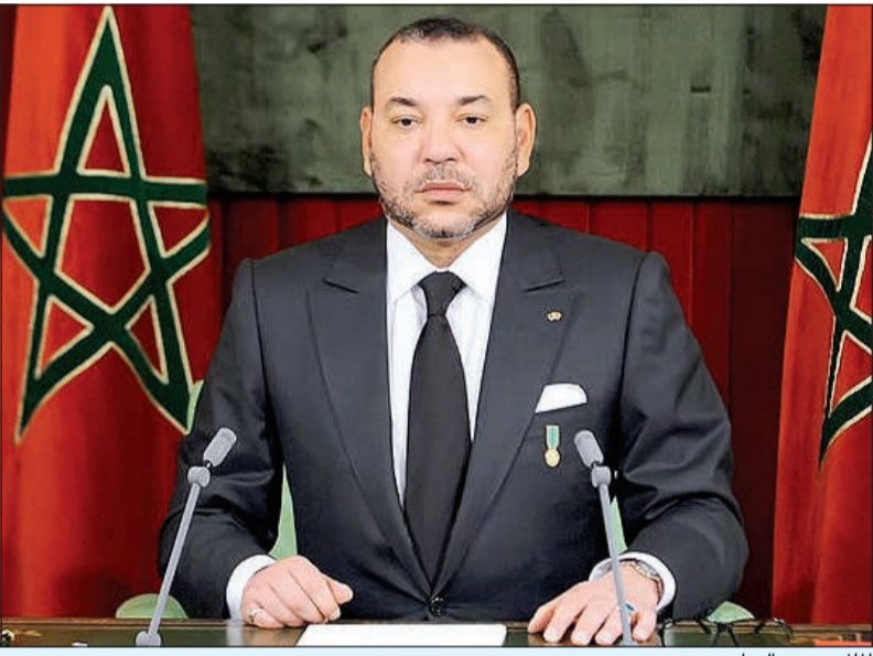
الملك محمد السادس