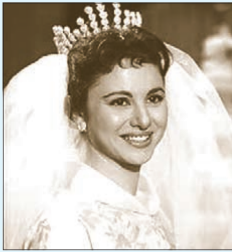
أبو ضحكة جنان

في فيلم «حكاية العمر كله»، كانت فاتن حمامة تمثل الفتاة الساحرة بكل ما تعنيه الكلمة من معنى، الشقاوة الجميلة، البنت التي أحبها فريد الأطرش، وغنى لها «يا بو ضحكة جنان»، وابتسامتها تنير الدنيا كلها وتخطف قلب الرجل، فيحلم بها عروسا، غير انها كانت تحلم بأخيها «أحمد رمزي» حبيب قلبها ورفيق طفولتها وشبابها.