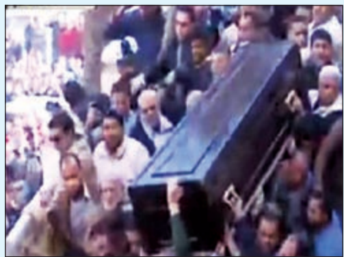
تدافع المشيعين أثناء الجنازة

أدى تدافع المشيعين لجنازة الفنانة الراحلة فاتن حمامة سيدة الشاشة العربية، إلى انهيار سلم أحد أبواب المسجد أثناء خروج الجثمان عقب أداء صلاة الجنازة عليه، وسقط عدد كبير من المشيعين على الأرض بعد أن تعرض النعش لحالة من الاهتزاز نتيجة لانهيار السلم وتدافع المواطنين على حمل النعش.