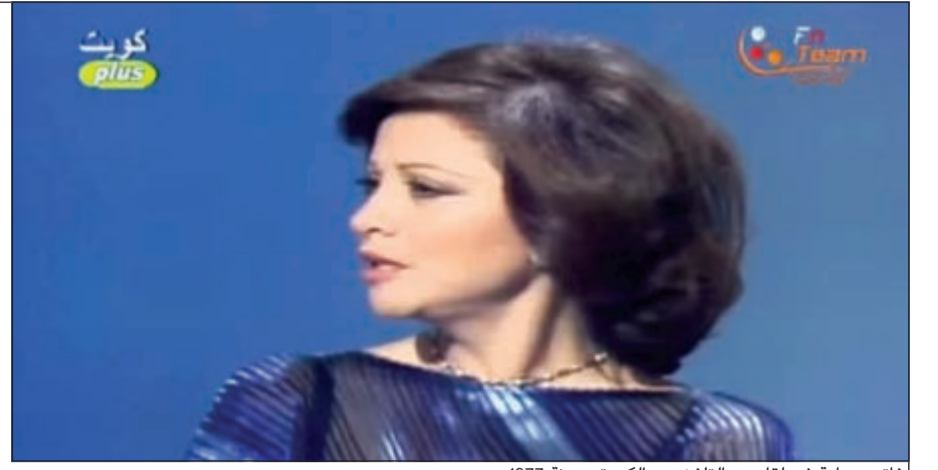
فاتن حمامة في لقاء مع التلفزيون الكويتي سنة 1977

بعد وفاة الفنانة الكبيرة «سيدة الشاشة العربية» فاتن حمامة، انتشر على مواقع التواصل الاجتماعي وتناوله برامج تلفزيونية مصرية كثيرة، فيديو لها وهي في لقاء نادر جدا في تلفزيون الكويت سنة 1977 وكان عبارة عن سهرة فنية جمعتها مع نجوم من الكويت وهم خالد النفيسي، سعاد عبدالله، مريم الصالح، أسماهان توفيق. وظهر من خلال اللقاء الحفاوة البالغة من نجوم الفن الكويتي بـ«سيدة الشاشة العربية» كفتاة لها ثقلها في الوسط الفني العربي، وقد تحدثت فاتن حمامة ببساطة وتلقائية وتواضع كبير عن مشوارها الفني الطويل وأهم أعمالها، مبدية إعجابها الشديد بالدراما الكويتية ونجومها، معبرة عن سعادتها بالظهور على شاشة تلفزيون الكويت ولقاء الجمهور الكويتي.