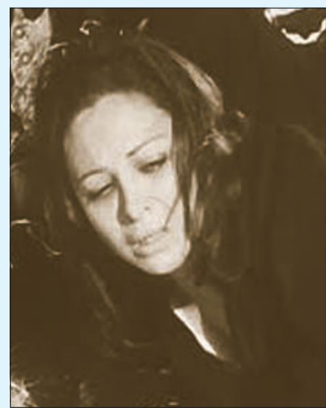
عزيرة في «الحرام»

عزيرة، في القصة الأشهر ليوسف ادريس «الحرام» هي النموذج القاتل للفقر والعوز والحاجة، ارتكبت الفاحشة رغما عنها، وهي تسعى لتجلب لقمة عيش لأولادها وزوجها الميت الحي، يوسف ادريس لم يكن يتحدث عن عزيرة كامرأة او مجرد فرد، الرجل كان يتحدث فيه أزمة بلد، يعيش فيه الفقر ويتزعرع بينما ينعم بقرواته أصحاب السطوة والكرباج، لتموت عزيرة ويموت وليدها، والكبار يسألون ببلاهة: هي عملت كده ليه؟