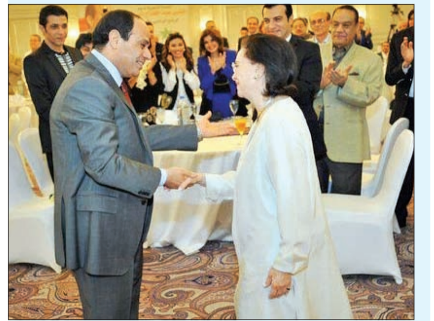
الراحلة مع الرئيس المصري عبدالفتاح السيسي في ظهور تادر لها أثناء الاحتفاء بالإعلاميين

وأشارت عبدالعزيز، في برنامج «بصند في مصر» على قناة «MBC مصر»، إلى أن آخر حديث بينها كان الخميس الماضي، وكان عن مشروع قناة السويس الجديدة، مضيفة: «فاتن كانت تتمنى أن تزور القناة الجديدة وحزنت عندما عرفت أنني قمت بزيارتها بدونها». وأضافت عبدالعزيز: «فاتن