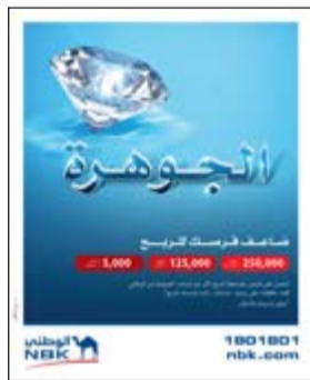
بوستر حساب «الجوهرة»