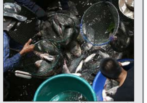
المركز وقد تحول إلى بركة أسماك

بانكوك - أ.ف.ب: تحول مركز تسوق كبير، في «بانكوك» عاصمة تايلند، إلى بركة مياه تملؤها الأسماك.