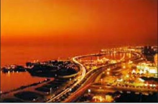
جدة عروس البحر الأحمر

جدة - العربية: أنهت أمانة محافظة جدة خلال الأيام الماضية جميع الاستعدادات اللازمة لإجازة منتصف العام 1436هـ حيث أكد معالي الدكتور هاني بن محمد أبو راس على جميع الجهات المعنية بتكثيف جهودها لخدمة المتنزهين وزوار محافظة جدة للاستمتاع بالأجواء الجميلة في الحدائق والأماكن العامة وعلى امتداد كورنيش جدة الذي تم تطويره مؤخرا. وأوضح مدير عام الحدائق والتشجير المهندس محمد قطان بأنه تم تهئية جميع المرافق السياحية من الحدائق، والمساحات العامة والواجهات البحرية، والشواطئ لاستقبال المتنزهين حيث تم عمل الصيانة اللازمة لها وللمسطحات الخضراء والألعاب وزراعة أكثر من 250 ألف زهرة في مختلف شوارعها، وأشار إلى أن الأمن وجه جميع الإدارات بالأمانة والبلديات التابعة لها للتنسيق لوضع برنامج عمل مستمر، حيث اشتملت تلك البرنامج على استمرار النظافة العامة على هذه المرافق والرقابة الميدانية الدائمة عليها، نظرا لكثافة مرتاديها من المتنزهين والزوار والسائحين خلال هذه الإجازة.