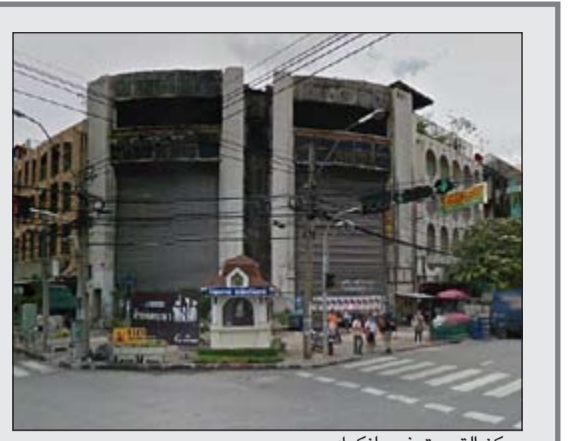
مركز التسوق في بانكوك