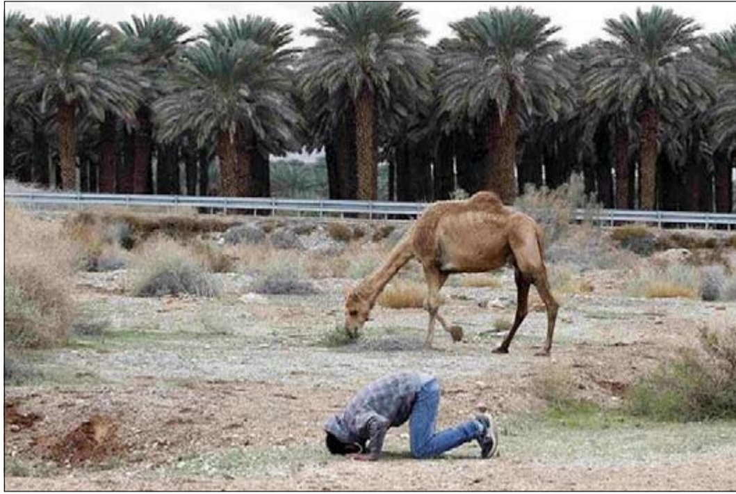
الصورة الأجل حسب تطبيق فلييبورد

روما - أ.ش: لم يقرأ قرابة 60% من الإيطاليين كتاباً قط من سنة إلى أخرى، كما أن ما يقرب من 10% من الأسر الإيطالية لا تمتلك كتباً على الإطلاق، وذلك وفقاً لإحصاءات جديدة صادرة عن وكالة الإحصاء الوطنية. وأفادت الأرقام بأن 41,1% فقط فوق سن السادسة قرأوا كتاباً من قبيل التسلية العام الماضي، مما يعد انخفاضاً تدريجياً من 46,8% في عام 2010. وأظهرت الأرقام أن النساء والبنات أكثر إقبالاً على القراءة من نظرائهم من الذكور، بنسبة 48% من الإناث قرأن كتاباً العام الماضي مقارنة بنسبة 34,5% فقط من الذكور. وأشارت الأرقام إلى أن المثقفين يوجدون على الأرجح في الشمال، مقارنة بالجنوب الإيطالي، كما أنه لا توجد كتب على الإطلاق في 9,8% من المنازل الإيطالية.