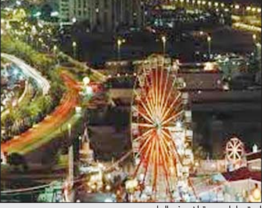
استعدادات جدة لنصف العام