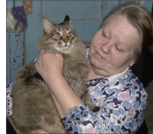
الجارحة تحمل القط

المصدر نفسه. وقال التلفزيوني إن القط ساهم في تدفئة الطفل الرضيع لساعات عدة بحرارة جسمه، «وعندما بدأ الطفل بالبكاء خرجت إحدى قاطنات المبنى من شقتها، فوجدته إلى جانب القط الذي كان يلحس وجه الطفل ويديه. وسكان المبنى على ثقة بأنه لولا اعتناء القط بالرضيع لكان توفي».