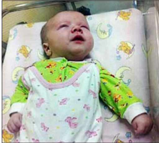
الطفل بعد إنقاذه

فلحق بالأطباء الذين نقلوه حتى صعقوا إلى سيارة الإسعاف. وأفاد شهود عيان للمحطة التلفزيونية بأن الطفل كان يرتدي ملابس نظيفة وجديدة، ووضعت إلى جانبه بعض الحفاضات، وأكد الأطباء أن حياة الطفل ليست في خطر، وهو تحت الرعاية في المستشفى. وباشرت الشرطة عمليات البحث عن الوالدين اللذين قد يواجهان ملاحقات قضائية حال التعرف عليهما.