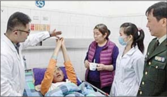
الصيني بعد ان عاد من غيبوبته

شنغهاي - وكالات: خرج رجل صيني من غيبوبة دامت أكثر من سنة بسبب وضع ورقة نقدية أمام عينيه وأنهف. وقالت صحيفة «نيويورك بوست»، إن الشاب، الذي دخل الغيبوبة في أغسطس 2013، أفاق عندما وضعت ممرضة ورقة نقدية من فئة 100 يوان أي 16 دولاراً، أمام أنفه وعينيه.