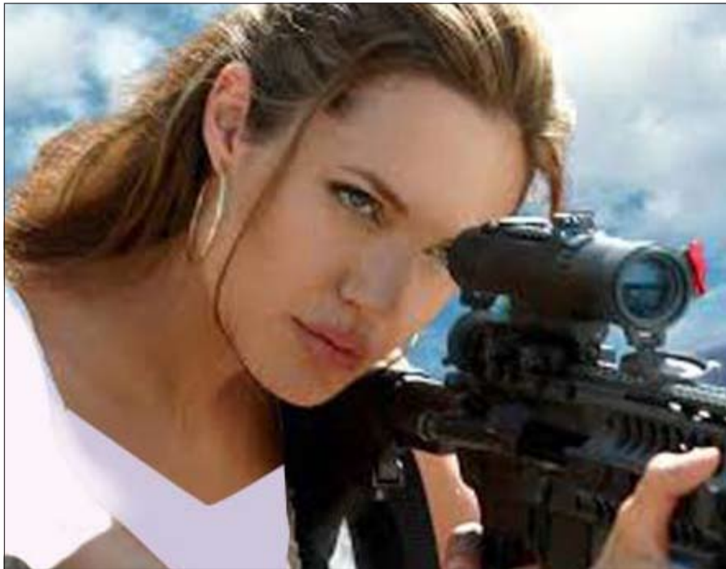
أنجلينا جولي مخرجة

وكالات: ذكر موقع مهتم بأخبار النجوم أن النجمة العالمية أنجلينا جولي مستاءة لعدم ترشح فيلمها Unbroken لأي من جوائز الغولدن غلوب، على الرغم من ترشيحه لجوائز بافتا كأفضل فيلم، وأفضل مخرج، وأفضل سيناريو، وأفضل تصوير، وأفضل وجه صاعد لبطله جاك أوكونيل. وأضافت أنها بذلت مجهوداً كبيراً ليخرج الفيلم في أيه صورة ممكنة، مؤكدة أنها لا تغازل بأفلامها المهرجانات، لكنها تراهن دائماً على الجمهور.