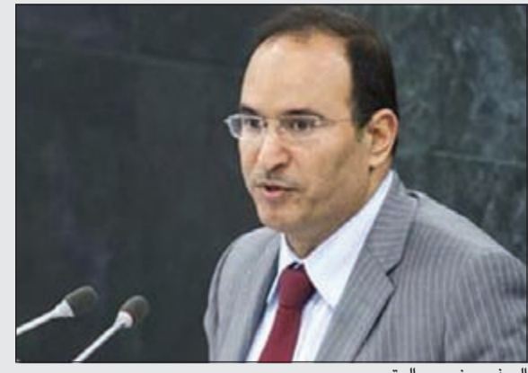
السفير منصور العتيبي

مليون دولار من الكويت. وشهد مؤتمر المانحين الثاني الذي عقد في الكويت أيضا خلال شهر يناير 2014 حشدا دوليا بمشاركة 69 دولة، وعودة اجمالي التبرعات المقدمة في المؤتمر من قبل المشاركين، حيث بلغت قيمتها 2,4 مليار دولار منها 500 مليون دولار من الكويت. وأوضح وزير الدولة لشؤون مجلس الوزراء الشيخ محمد العبدالله أن تبرعات الكويت التي بلغت 500 مليون دولار للشعب السوري أتت 300 مليون دولار منها تبرعا من حكومة الكويت و200 مليون حصيلة تبرعات المنظمات الخيرية غير الحكومية. يذكر أن منظمة أوكسفام للمساعدات الإنسانية أعلنت في دراسة نشرت في 15 يناير 2014 أن الكويت قدمت ما يفوق الحصص التي تعد عادة بالنسبة إلى الجهود الإنسانية الخاصة باللاجئين السوريين بنسبة 1444٪.