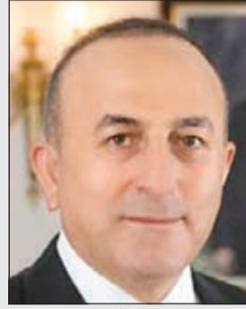
مولود جاويش أوغلو

جاويش أوغلو أهمية الدور الذي تلعبه الاستثمارات الكويتية في تركيا والتي بلغت 1,4 مليار دولار في خلق فرص عمل للاقتصاد التركي خاصة في القطاع المصرفي والعقاري، داعيا رجال الأعمال والشركات الكويتية لاكتشاف فرص استثمارية مربحة في تركيا. ولفت إلى وجود حوالي 160 شركة استثمارية ذات رأس المال كويتي في تركيا إضافة إلى 260 فرعا لبنك «كويت ترك» التابع لبيت التمويل الكويتي وامتلاك بنك برقان الكويتي أسهما في أحد البنوك التركية، معربا عن تقديره للكويت لإدراج بلاده ضمن قائمة الجهات الاستثمارية ذات الأولوية في عام 2005. وعن مجالات الاستثمار التركي في الكويت قال جاويش أوغلو إن شركات المقاولات التركية ساهمت في بناء مشاريع بنى تحتية مهمة في الكويت محققة