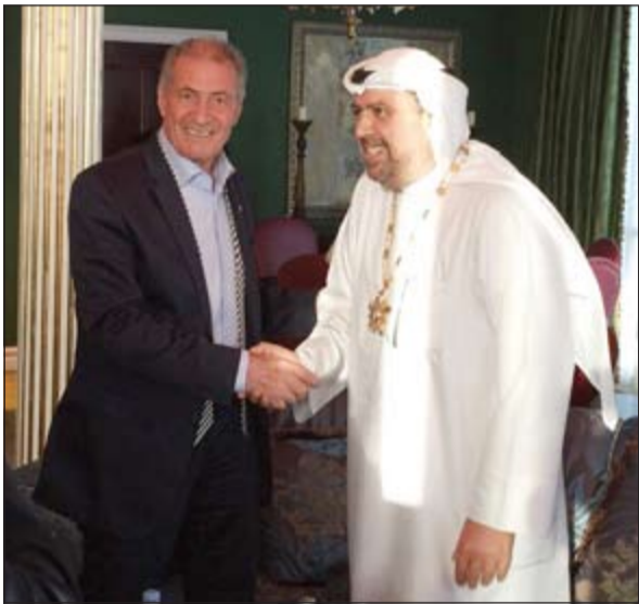
الشيخ أحمد الفهد يتسلم الوسام من رئيس الاتحاد الدولي لكرة اليد حسن مصطفى