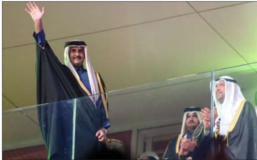
أمير قطر الشيخ تميم بن حمد آل ثاني وبجانبه رئيس المجلس الأولمبي الآسيوي الشيخ أحمد الفهد

واكد ان اللجنة المنظمة للبطولة والقائمين عليها استطاعوا برئاسة الشيخ جوعان بن حمد آل ثاني وبمباركة ودعم أمير قطر الشيخ تميم بن حمد آل ثاني ان يقدموا صورة جميلة عن قطر والخليج والعالم العربي من خلال هذه البطولة سواء من خلال المنشآت الجميلة المتميزة او من خلال الافتتاح الرائع. وتقدم الفهد بالتهنئة