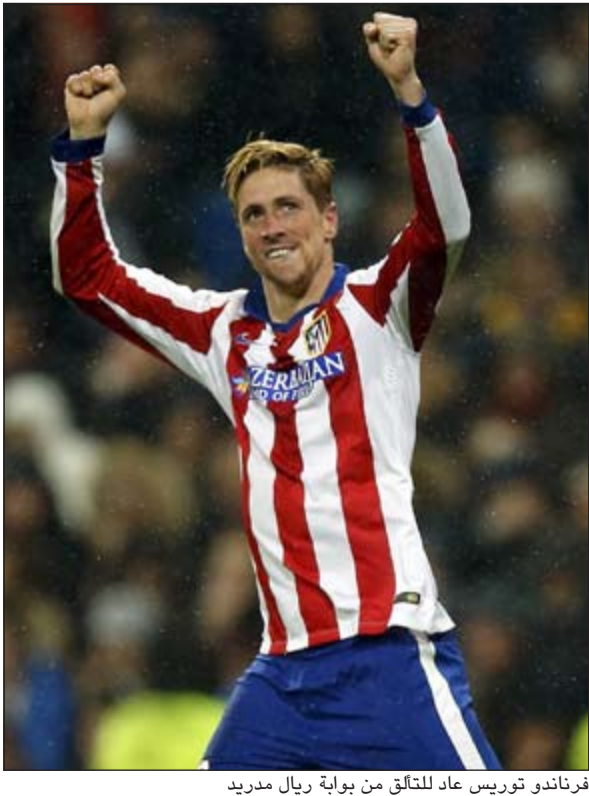
فرناندو توريس عاد للتلق من بوابة ريال مدريد

المحلي للمرة الأولى منذ 2001 وذلك عندما يحل ضيفا على «ستاديو رينزو باربيرا». وانتر ميلان وضيغه امبولي اليوم على استاد «كارلو-كاستيلاني» بعد ان عزز الأول صفوفه بالألماني لوكاس بودولسكي من أرسنال الإنجليزي على سبيل الاعارة والسويسري شيردان شاكري من بايرن ميونخ الألماني على سبيل الاعارة أيضا. ويحتل انتر الذي يقوده المدرب روبرتو مانشيني خلفا للونتر ماتزاري المركز التاسع برصيد 25 نقطة متخلفا بفارق نقطة واحدة عن جاره ميلان.