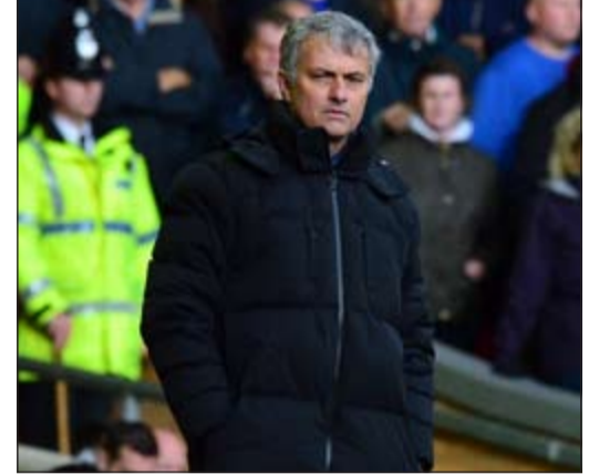
جوزيه مورينيو قد يجري بعض التعاقدات

أكد مدرب تشلسي جوزيه مورينيو أنه سيكون سعيدا إذا لم يتم إجراء أي صفقة في فترة الانتقالات الشتوية في يناير الجاري، لكنه اعترف بأن كل شيء ممكن وأن النادي قد يجري بعض التعاقدات. وأكد مورينيو في مؤتمر صحفي أن تشكيلة فريقه قوية في الوقت الحالي، إلا أن سوق الانتقالات يبقى مفتوحا أمام البلوز في حال حدوث أي طارئ. وقال المدرب البرتغالي: «ساكون سعيدا إذا لم يغادر أحد صفوف تشلسي في سوق الانتقالات الشتوية، وساكون سعيدا أيضا إذا لم يأت أي شخص إلى فريقنا ولكن السوق يبقى مفتوحا ولا أحد يعرف ماذا سيحدث أبدا». وكشف مورينيو أن حارس المرمى تيبو كورتوا جاهز للمباراة ضد سوانزي سيتي ولكن ليس بنسبة 100٪، في إشارة ربما إلى استمرار مشاركة بيتر تشيك في مركز حراسة المرمى خلال مباراة اليوم. وعلى الرغم من صدارة تشلسي للترتيب العام، إلا أن جوزيه مورينيو أصر على أن تشلسي ليس مفضلا للفوز في الدوري الإنجليزي هذا الموسم مع أو من دون تعاقدات جديدة، وأضاف: «نحن لسنا مفضلين للحصول على اللقب، نحن مرشحون، ساقول الشيء نفسه حتى لو كنا يفارق نقطتين عن أقرب المطاردين». ولم يتردد مورينيو في القول أنه سيكون من الصعب على مان يونايتد المنافسة على اللقب من مركزه الحالي في المركز الرابع، خصوصا لما يقدمه ساوثامبتون الذي يحتل المركز الثالث، فيما أشار إلى أن مان سيتي هو المنافس الأكبر لتشلسي في السعي للحصول على اللقب.