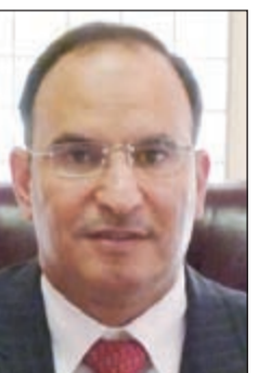
السفير منصور العتيبي

الصريح والسافر لتنفيذ قرارات الشرعية الدولية وتعمدها تجاهل هذه القرارات والاستهزاء بها. واعتبر العتيبي انه «في المقابل يقف المجتمع الدولي وللأسف الشديد عاجزاً عن حمل السلطة القائمة بالاحتلال على تنفيذ قراراته، بل ان مجلس الأمن برفضه مشروع القرار العربي في 30 ديسمبر الماضي والذي يؤكد على قرارات الشرعية الدولية المطالبة بإنهاء الاحتلال فإنه يمنح إسرائيل الضوء الأخضر لمواصلة ممارساتها وبالتالي تقويض أي فرصة للسلام الحقيقي يمنح الشعب الفلسطيني حقوقه المشروعة». ورأى أن «سياسات إسرائيل غير القانونية وغير الشرعية في الأرض الفلسطينية المحتلة بما فيها القدس الشرقية مستمرة بلا