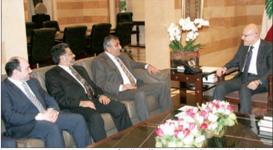
رئيس الوزراء اللبناني تمام سلام مع وفد الصندوق الكويتي للتنمية

لتمويل مشاريع مختلفة بقيمة تبلغ نحو 211 مليون دينار فيما قدم ثمانية منح بقيمة تقدر بنحو 3.5 ملايين دينار لتمويل مشاريع القطاع الصحي وتدريب الكوادر الحكومية.