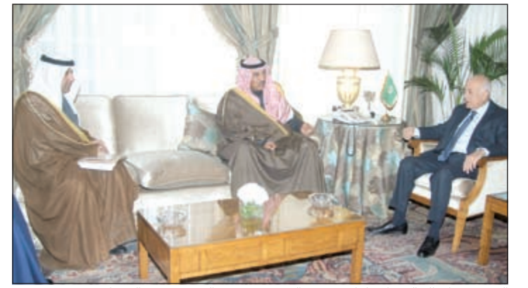
الشيخ صباح الخالد خلال لقائه د.نبيل العربي بحضور السفير عزيز الديحاني