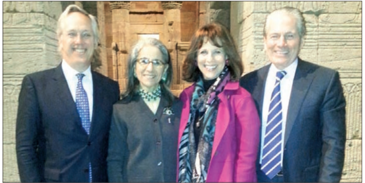
الشيخة حصّة الصباح مع ثلاثة من المشاركين في اجتماع مجلس أمناء «متروبوليتان»

معرض خاص لمقتنيات دار الآثار الإسلامية في ولاية تكساس الأميركية نهاية الشهر الجاري.