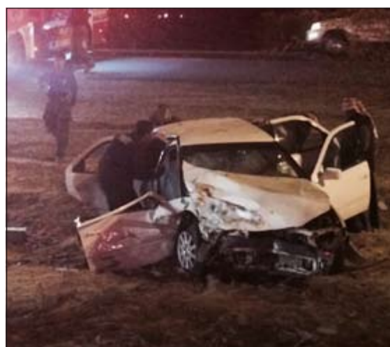
رجال الاطفاء يقومون بإخراج المصابين من احدى المركبتين

فيما نقل الطرف الآخر أيضا إلى المستشفى ووصفت حالته بالمستقرة.