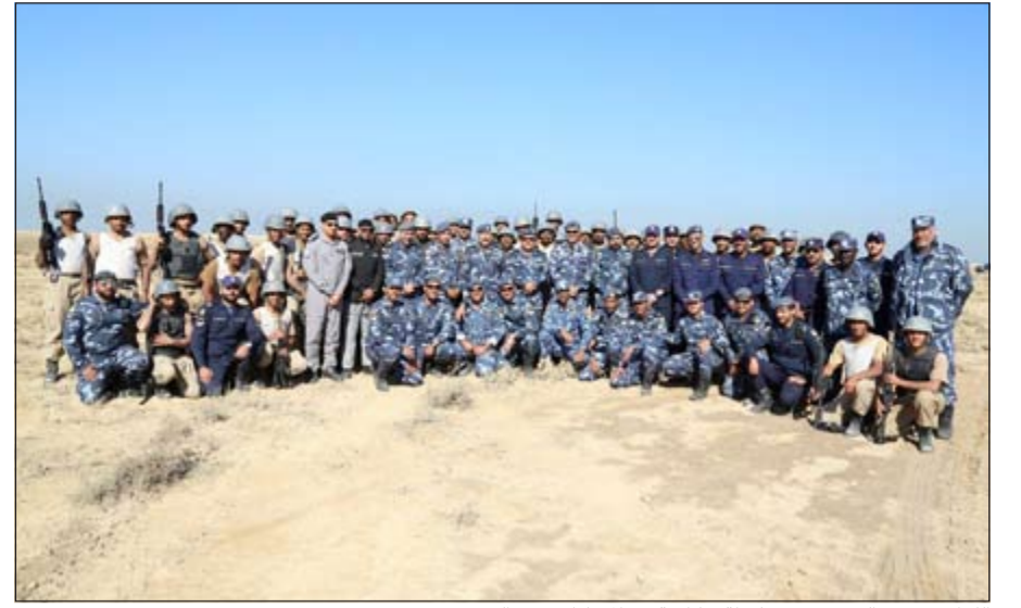
اللواء محمود الدوسري في لحظة تذكارية مع المشاركين في الدورة

الجريمة وحفظ أمن واستقرار المجتمع. وفي الختام، تقدم اللواء محمود الدوسري بالشكر والتقدير إلى طاقم التدريب وما بذلوه من جهود لاكتساب المتدربين مزيداً من الخبرات، كما أثنى على مستوى المتدربين وأدائهم الجيد طوال مراحل الدورة حتى المشروع النهائي والتطبيق العملي والذي شهد رماية بالذخيرة الحية بالمدربات في محاكاة للواقع والقتال في المناطق المبنية.