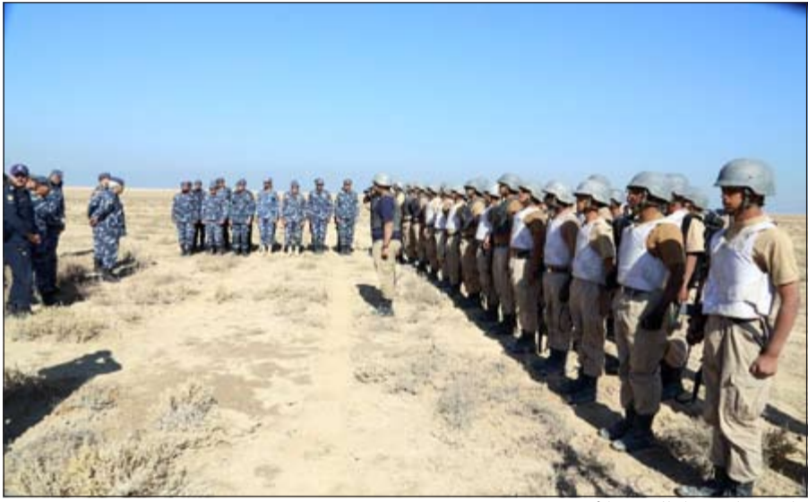
جانب من الاستعداد للتمرين الأخير