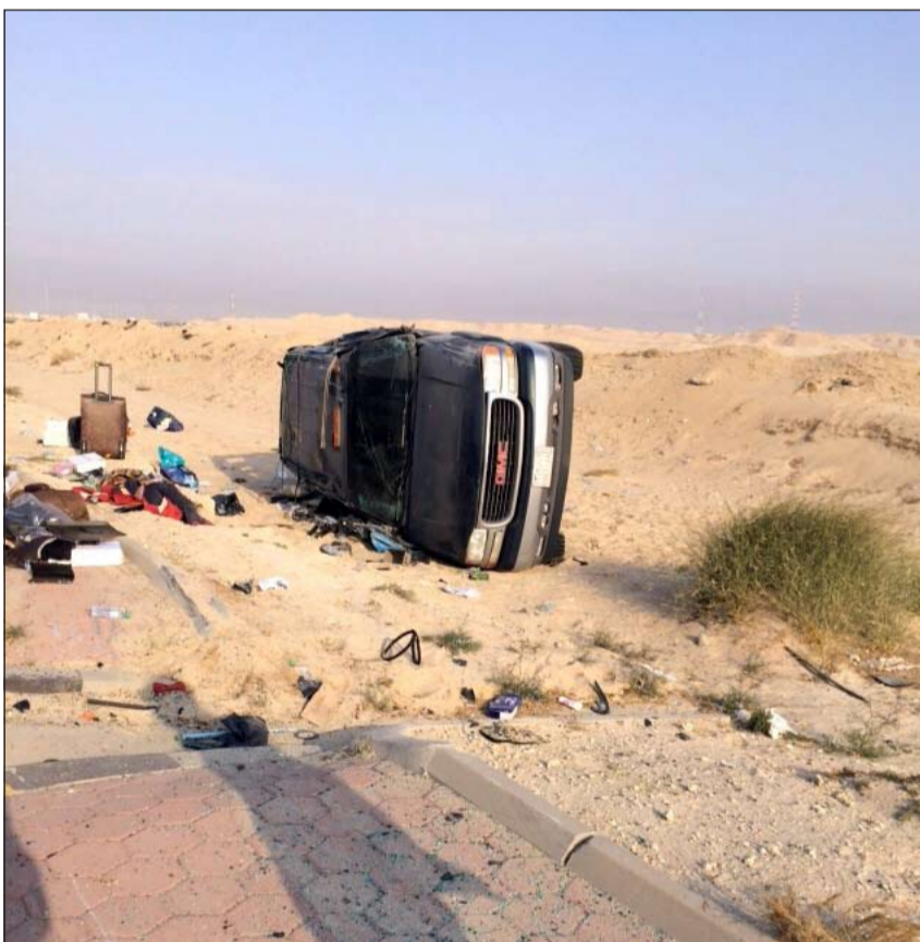
السيارة على جانب طريق المطلاع

قام رجال جمارك الدوحة منذ مساء امس الاول بتكثيف الاجراءات التفتيشية على جميع اللجنات والسفن التجارية الصغيرة، وذلك بعد ضبطهم 300 بدلة عسكرية في لحن يقوده مواطن كان يستعد للمغادرة بها إلى ايران،