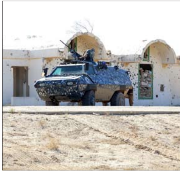
جانب من التدريب الختامي للمشاركين في الدورة