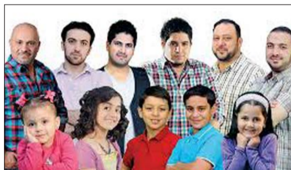
فرقة طيور الجنة

وتفكيرهم. وأشارت اسماعيل إلى أن فرقة طيور الجنة تقدم لوحة فنية رائعة من الانسجام والتناغم تحصل العديد من القيم الأخلاقية والتربوية العالية، حيث تشدو الفرقة بباقه متنوعة من أجمل أغانيها الجديدة، لافتة إلى أن هذه الفرقة تعد من أشهر الفرق الفنية المتخصصة في فنون الأطفال وأكثرها انتشارا في الوطن العربي، حيث تقدم أناشيد خاصة بالأطفال من خلال طابع فني يناسب أعمارهم وتفكيرهم، مشددة على أن هذه الفرقة تعد من العوائل الفنية التي شكلت لوحة فنية رائعة، ويميزها توافق أعضائها على الأهداف والغايات النبيلة.