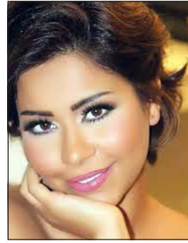
شيرين عبد الوهاب

عبر أمسيات مهرجان «هلا فبراير 2015»، والتي غاب عنها ما يزيد على عامين، لكنه لم يغيب عن جمهوره الكويت حيث قدم العديد من الحفلات منها مشاركته في ليالي المباركة. ويحضر الفنان القطري فهد الكبيسي إلى هذا الحفل وهو بديك قوة وأهمية الجمهور الكويتي وتذوقه للغناء وقدرته في المساهمة على إبداع الفنان وانتشاره، ولذلك سيكون مستعدا بما يتناسب مع هذه الليلة ومن يشاركون فيها، والمتابع للكبيسي سيجد أنه من أكثر المطربين الشباب في الخليج مشاركة في المهرجانات والحفلات، ليس على مستوى الخليج فحسب وإنما على مستوى الوطن العربي، فمُنذ عام 1997، عندما شارك في مهرجان قطر الإنشادي، استمر في حضور المنمیز، حيث شارك في مهرجان الدوحة الفني، وفي حفل اختار الرياض عاصمة الثقافة العربية.