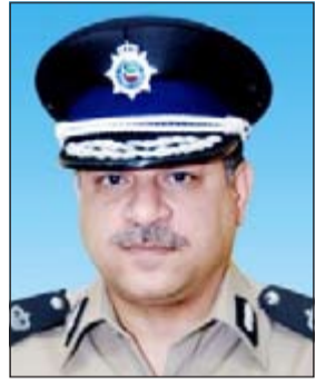
اللواء جمال الصايغ

أكد وكيل وزارة الداخلية المساعد لشؤون العمليات اللواء جمال الصايغ جاهزية قطاعات وزارة الداخلية المختلفة لمواكبة فعاليات مهرجان هلا فبراير 2015 منذ انطلاقته وحتى ختامه. وقال الصايغ في تصريح صحافي أمس إن العمل متواصل من أجل تنفيذ آلية عمل الخدمات الأمنية المواكبة لفعاليات «هلا فبراير» والتي تم إعدادها لتغطية جميع الأنشطة في مواقعها المتفرقة كما تم البدء بالانتشار الأمني اعتبارا من 4 يناير الجاري وحسب التواريخ التي وضعت لكل منها، مشيرا إلى أنه تم إغلاق كل المواقع الخاصة بالكرنفال اعتبارا من صباح اليوم وحتى الثامنة صباحا موعد انتهاء الكرنفال، كما سيتم إغلاق خط السير من تقاطع جمعية المهندسين مع شارع الخليج العربي حتى تقاطع السفارة البريطانية بالانجاءين اليوم الجمعة من الصباح حتى الـ 11 ليلا. وأضاف: أنه تم اعداد وتجهيز كل الخطط الأمنية