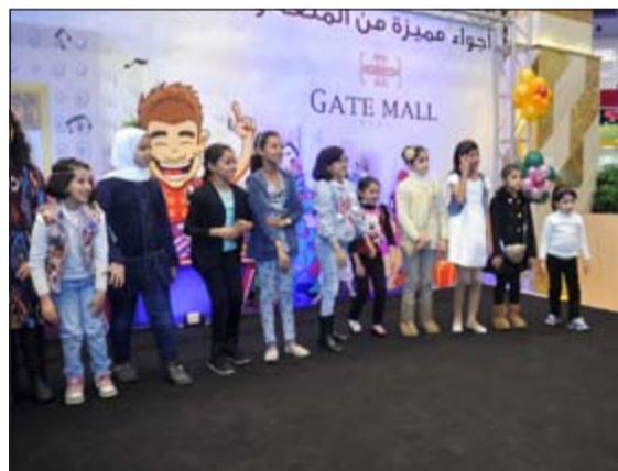
جانب من فعاليات «هلا فبراير» المتميزة في «جيت مول»

حل رئيس اتحاد الإذاعة والتلفزيون المصري عصام الأمير ضيفا عزيزا على الكويت، ليشارك في فعاليات مهرجان «هلا فبراير للتسوق 2015»، عقب تلبية دعوة رسمية وجهت إليه. ويعتبر الأمير من رواد المجال الإعلامي في جمهورية مصر العربية، حيث تدرج في العمل التلفزيوني وأثبت قدرته على تطوير المفهوم الإعلامي وتخرج الأمير في كلية الإعلام جامعة القاهرة عام 1985، وعين مخرجا بالتلفزيون، ثم تولى منصب رئيس قسم الإعداد والتنفيذ بالقناة الثالثة المصرية، ثم