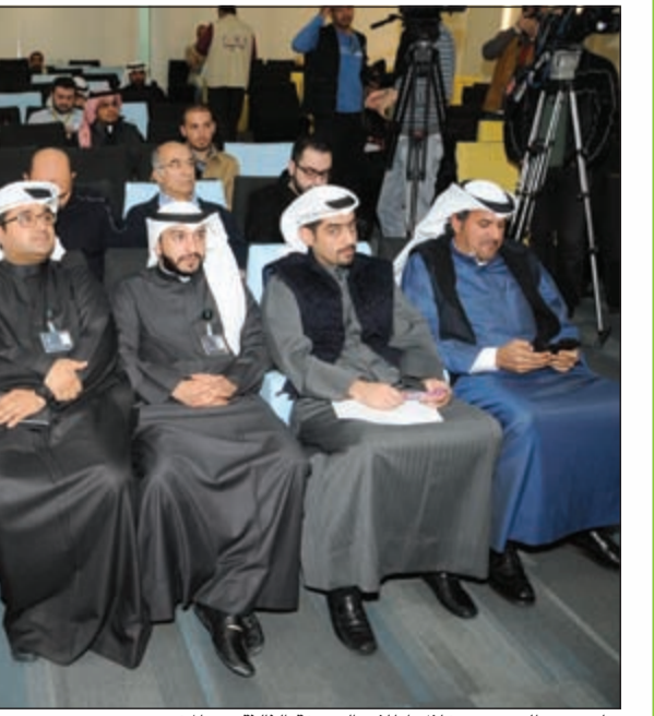
جانب من الحضور خلال إطلاق النسخة الثالثة من المشروع

وأفاد بان النسخة الجديدة من البرنامج هذا العام على المشاريع المتعلقة بالمنتجات التكنولوجية والحلول التقنية مثل تطبيقات الهواتف الذكية وتقديم الخدمات من خلال مواقع الإنترنت التفاعلية وغيرها التي تقدم المشاريع التجارية، والمشاريع المجتمعية، وذلك لإيمان الشركة الشديد بأهمية الوسائل والحلول التقنية في العصر الحالي خصوصاً