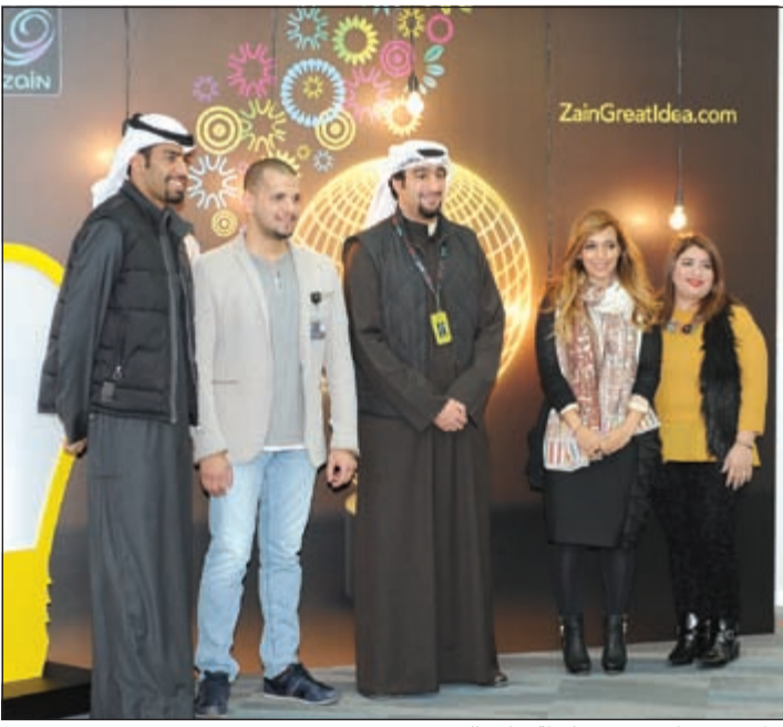
مبادرو وموظفو زين في لقطة خلال الحفل