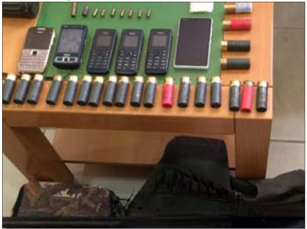
الشوزن والطلقات والمخدرات اُحيلت إلى الاختصاص

أحال مدير امن محافظة الجھراء والعاصمة بالإنابة اللواء إبراهيم الطراح يوم أمس خليجياً إلى الإدارة العامة لمكافحة المخدرات على أن يحال لاحقاً إلى الإدارة العامة للتنقيب لكونه مطلوباً لأحكام قضائية بلغت 32 عاماً. وحسب مصدر أمني فإن دورية تتبع أمن الجھراء وخلال جولتها لها في منطقة رحية اشتبهت في مركبة بداخلها شخص ولدى الطلب منه التوقف، رفض وحاول الهرب لنتم ملاحقته وإجباره على التوقف، وبتفتيش سيارته عثر بداخلها على عدد 1 شوزن و49 طلقة شوزن و8 طلقات لسلاح ناري (مسدس) ومسدس صغير إلى جانب 55 حبة صفراء اللون يشبه أنها مخدرة، وشبو وأدوات تعاط ومبلغ مالي يقدر بـ300 دينار غير معلوم المصدر.