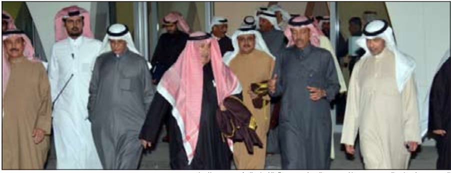
الفريق سليمان الفهد في مطار حمد الدولي برفقة اللواء الركن سعد الخليفي

لشؤون العمليات اللواء جمال الصايغ ووفد أمنى متخصص. وقبيل مغادرته قام الوكيل الفهد بزيارة لمطار حمد الدولي رافقه خلالها مدير عام الأمن العام في دولة قطر الشقيقة اللواء الركن سعد بن جاسم محمد الخليفي حيث اضطلع خلالها على الأنظمة الأمنية المعمول بها، مروراً بالبوابات الإلكترونية الحديثة ومراميل وإجراءات وخطوات التفتيش على الركاب القادمين منذ لحظة وصولهم حتى إنهاء إجراءاتهم ودخولهم إلى البلاد، وكذلك المغادرون.