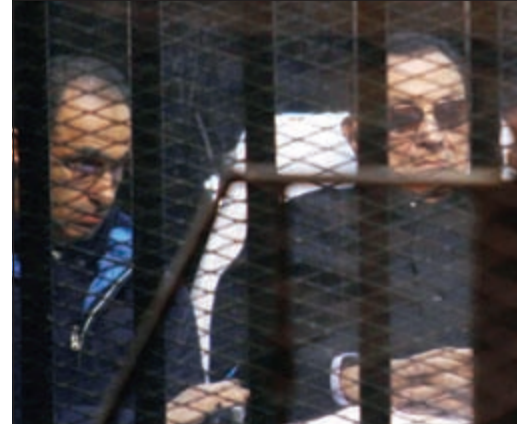
صورة تعود إلى نوفمبر الماضي لحسني مبارك ونجله جمال