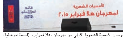
فرسان الأصيلة الشعرية الأولى من مهرجان «هلا فبراير» (اسامة ابويعقوب)

الأمسية الأولى أشعلت أجواء مهرجان هلا فبراير