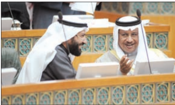
صاحب السمو الأمير الشيخ صباح الأحمد في لقطة تذكارية مع رئيس وأعضاء المبادرة الكويتية لمساندة الشعب المصري

وافق مجلس الأمة في جلسته العادية أمس على تقرير لجنة مشروع الجواب على الخطاب الأميري بشأن الصيغة النهائية للمشروع عن دور الانعقاد الثالث للفصل التشريعي الـ 14 وقرر رفعه الى صاحب السمو الأمير. وخلال الجلسة، كلف