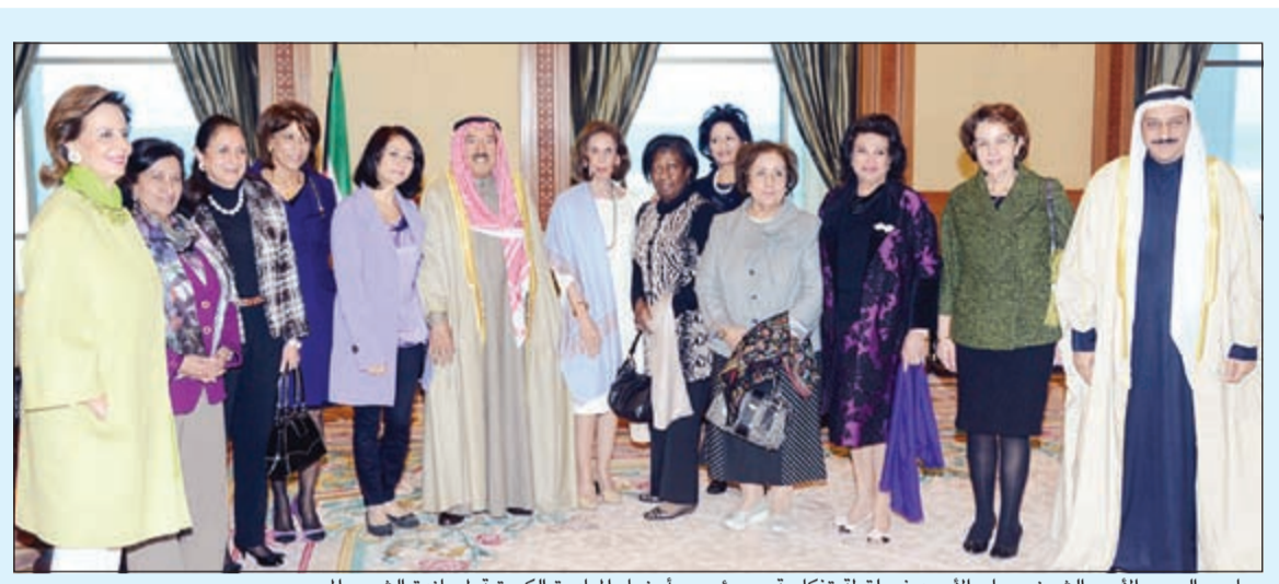
صاحب السمو الأمير الشيخ صباح الأحمد في لقطة تذكارية مع رئيس وأعضاء المبادرة الكويتية لمساندة الشعب المصري

صاحب السمو استمع إلى شرح حول الأعمال الخيرية للمبادرة الكويتية لمساندة الشعب المصري