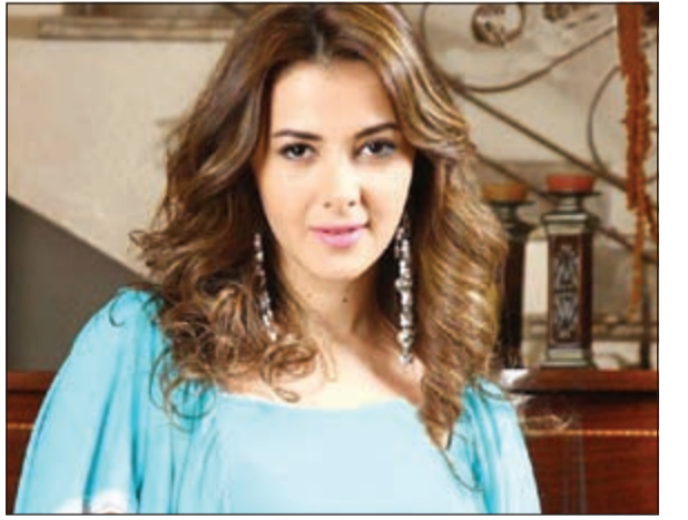
دنيا سمير غانم

انتشرت أخيرا أخبار تؤكد أن الفنانة دنيا سمير غانم ستكون ضمن لجنة تحكيم برنامج «إكس فكتور» في نسخته الجديدة، وأنها ستكون ضمن فريق جديد للبرنامج الذي سيرعرض على شاشة «أم بي سي» وذلك بعد أن عرض موسمه الأول عبر «CBC المصرية»، و«روتانا خليجية»، على أن يضم فريقه الجديد إلى جانب دنيا كلا من راغب علامة واليسا وحسن الجسمي. إلا أن مصدرا موثوقا من داخل «أم بي سي» كشف، حسب موقع «نواعم»، أن القناة ستعلن عن الأسماء في مؤتمر سيقام خلال الفترة المقبلة، وأن كل ما يقال حتى الآن عبر المواقع هو مجرد تكهنات، ولكن القناة ستعلن ذلك خلال أيام بعيدا عن كل تلك الشائعات. وتابع المصدر بالقول: إنه من قبل ترددت أسماء أخرى، ولكن في