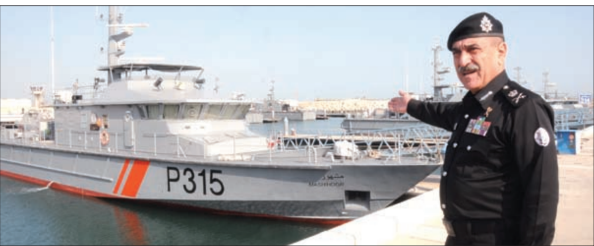
الدوريات البحرية تجوب المياه الإقليمية وطاقمها مسلح

● أحب أن اطمن جميع من يقيم على هذه الأرض بأن حدودنا آمنة تماما وأقول لهم: أيناؤكم يقومون على حمايتكم وحراستكم فلا تخافوا ونحن مستعدون للتضحية بحياتنا من أجلكم وأقول لأخواني وأبنائي عليكم بالحيطة والحذر، فليدكم أمانة في أعناقكم فكونوا عند قدر المسؤولية.