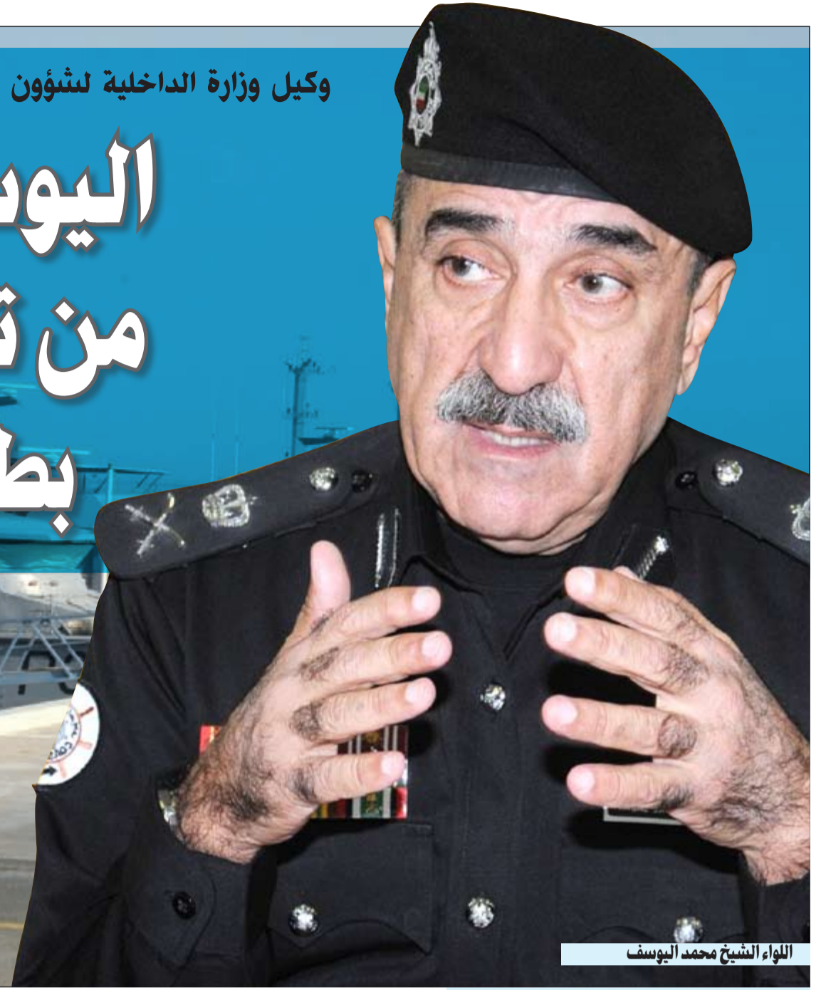
الواء الشيخ محمد اليوسف

بالخطر سواء نحن أو الدول المشتركة حدوديا معنا، والكل يعمل من أجل الحفاظ على أمن بلادنا، وبالتالي فإن الحدود الكويتية الممتدة على مسافة 800 كيلومتر منضبطة للغاية سواء من قبلنا أو من قبل الدول المشتركة مع حدودنا.