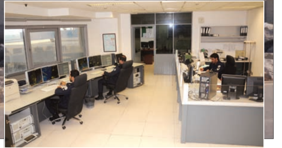
غرفة عمليات خفر السواحل أثناء متيقظ على مدار الساعة

الخطورة إن، ومادمت تطرقت إلى هذا الأمر أحب أن أشير إلى أننا مستعدون لتشغيل هذا المعبر متى ما طلب منا.