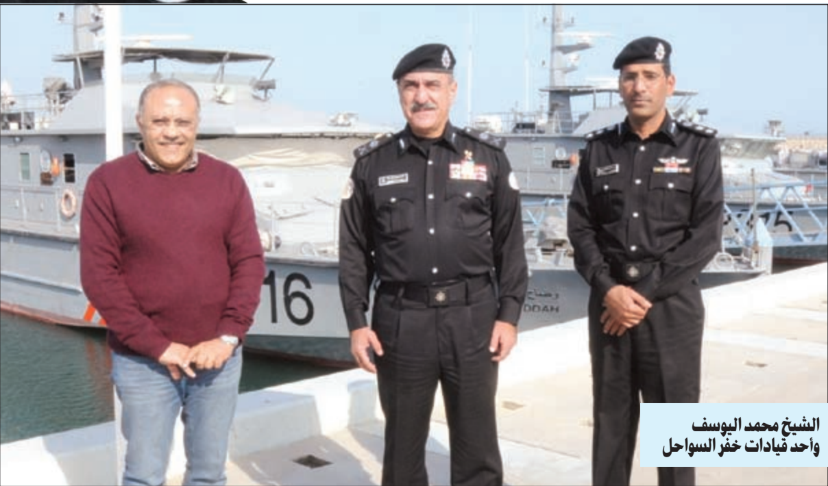
الشيخ محمد اليوسف وأحد قيادات خفر السواحل