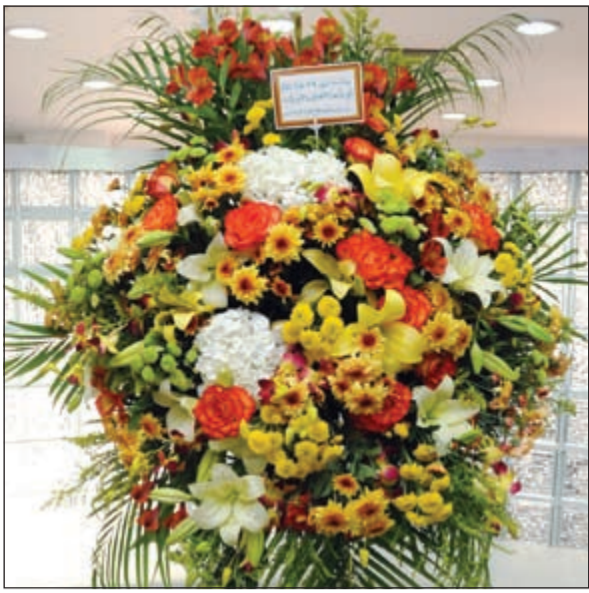
زهور من مجموعة السائير في عيد «الأبناء» (فريال حماد)