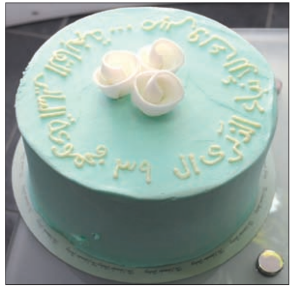
كعكة من مجموعة السائير الفاخرة