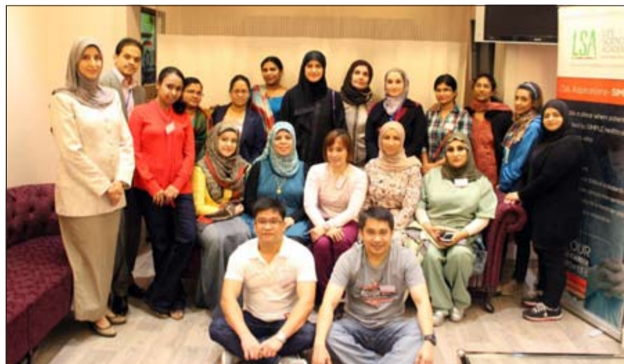
لقطة جماعية للمشاركين في البرنامج التدريبي

بمستوياتهم المهنية من خلال عدة محاور منها تشخيص وعلاج الحالات غير المستقرة، التدريب على المهارة العلمية لإدارة الأزمات، توفير طرق لراحة المرضى في أقسام الطوارئ، تقديم رعاية نهاية الحياة، طرق التواصل والتفاوض على الأمور المتعلقة بأخلاقيات المهنة، قياس المؤشرات مراقبة الجودة، والتحقق من كفاءة العاملين الإكلينيكية في بعض الأمور وفي مقدمتها مراقبة السدرة الدموية، مضيافاً «فسي نهاية البرنامج يكون المشاركون قادرين على التعرف على التحقيق السريري باعتباره الكفاءة الرئيسية للعاملين بأقسام الطوارئ، ومناقشة طبيعة نظام التصنيف في المؤسسة التابع لها»، واختتم الخليلي بالقول: «حرصنا في أعمالنا وأنشطتنا التدريبية لعام 2014 على تقديم أفضل الخبرات للمشاركين في برامجنا والتي تمت بالتعاون مع جامعات معتبرة ومراكز تدريبية متخصصة في تقديم دورات عملية ذات جودة عالية نسعى من خلالها إلى تطوير العاملين في القطاع الصحي في الكويت على اختلاف تخصصاتهم».