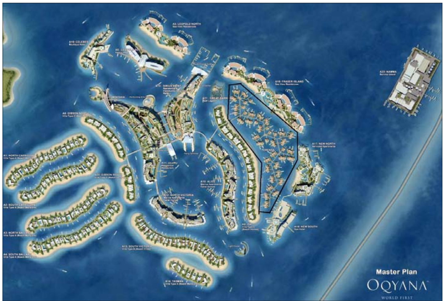
مجسم لمشروع جزر أوكيانا في مشروع جزر العالم بدبي