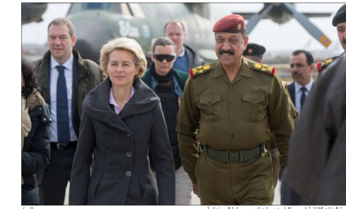
وزير الدفاع الألمانية أورسولا فون ديرلين لدى وصولها إلى بغداد أمس

بغداد - وكالات: أعلن اللواء كاظم محمد الفهداوي، قائد شرطة محافظة الأنبار غربي العراق أمس، إن 40 عنصرا من تنظيم الدولة الإسلامية «داعش» قتلوا خلال مواجهات مع القوات الأمنية وقصف لطيران التحالف الدولي لمواقع التنظيم في مدينة الرمادي ومحيطها. وفي تصريح لوكالة «الأناضول»، أوضح الفهداوي، أن قوة من الجيش والشرطة بمساعدة مقاتلي العشائر الموالية للحكومة صدت صباح أمس، هجوما لـ«داعش» على منطقة السجارية شرقي مدينة الرمادي مركز محافظة الأنبار، وأدت المواجهات والاشتباكات بين الطرفين لمقتل 20 عنصرا من التنظيم وتدمير مركبة تابعة لهم، فيما أصيب عنصران من الشرطة بجروح. وأضاف الفهداوي أن «داعش» كان يسوي من خلال هجومه استعادة السيطرة على أجزاء من منطقة السجارية التي تمكنت القوات الأمنية من السيطرة عليها مؤخرا وطرد عناصر التنظيم منها. ولفت قائد الشرطة إلى أن طيران التحالف الدولي شن غارات على عدد من المواقع التابعة لـ«داعش» في محيط الرمادي وتمكن من قصف تلك الأهداف بدقة عالية ما أسفر عن مقتل 20 عنصرا من التنظيم وتدمير مقرين لهم في منطقتي «التاميم» و«الخمسعة كيلسو» غربي الرمادي، وأخر في منطقة السجارية. من جهة أخرى، عاود