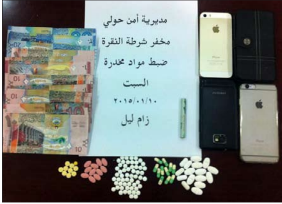
الحبوب المخدرة احييت لـ «المكافحة»