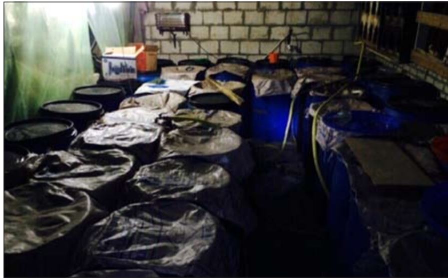
تقسمة سكنية تحولت إلى مصنع خمر في الوفرة

أمر وكيل وزارة الداخلية المساعد بإحالة 4 وأقدين آسيويين إلى الإدارة العامة لمكافحة المخدرات بعد مدهامة أحد أكبر أوكار تصنيع الخمر المحلية، وقال مصدر امني ان معلومات وردت إلى اللواء العلي عن استغلال عدد من الآسيويين لإحدى القسامت في تصنيع الخمر، وعليه أمر مدير أمن الأحمدى باقتحام القسيمة وضبط من بداخلها، وقام مدير الأمن بتنفيذ الأمر وضبط بداخل الوكر عدد 69 برميلاً معبأ بالخمر الى جانب 1332 بطل خمر سعة ليتر ونصف الليتر إلى جانب 4 آسيويين.