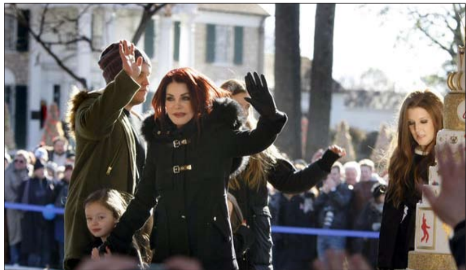
معبود بريسلي يحتفلون بذكرى ميلاده

وأضافت ليزا ماري (46 عاما) وهي مغنية ومؤلفة موسيقية وقد رافقها أولادها الأربعة «لا يسعنا أن نكون في أي مكان آخر»، وتوفي الفيس بريسلي في 16 أغسطس 1977 عن 42 عاما. ونظم مزاد علني تضمن قطعا مثل أول شهادة سوق لنجم الروك والسترة التي ارتداها في فيلم «فيفا لاس فيغاس» (1964) وأول أسطوانة سجلها في استديوهات «صن استوديو»، من أجل والدته في سن الثامنة عشرة.