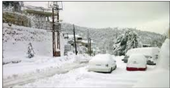
الثلج تغطي شوارع وسيارات لبنان

بدى أن إقامتها في الأردن ستطول أكثر، ما جعل السلطات تقرر تمديد تعطيل المدارس والدوائر الحكومية لليوم الثاني على التوالي مع توقعات من الأرصاد المحلية بهطول كميات من الثلوج على العديد من المناطق، كما سببت إرباكا في حركة الملاحة الجوية، إذ ألغيت العديد من الرحلات من وإلى الأردن.