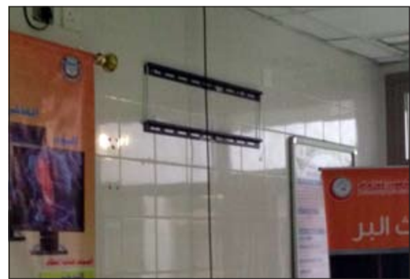
هنا كان التلفاز

الطبي والحراس لصلاة الظهر وتمكنوا من سرقة جهازي تلفاز نوع بلازما، وقال مصدر أمني ان عينة من دماء أحد اللصوص أحيلت الى الطب الشرعي للاستئلال على الجناة، وكشف مصدر أمني ان بلاغا