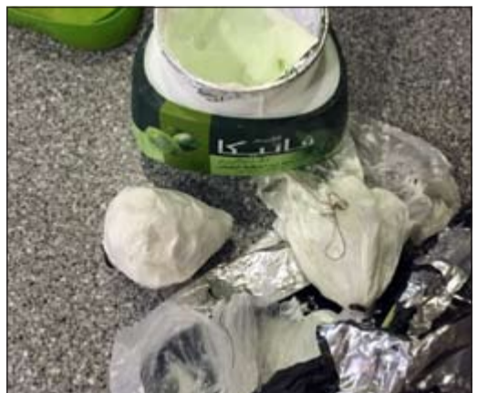
الكريم أداة تهريب حبوب