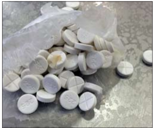
المضبوطات بعد الكشف عنها