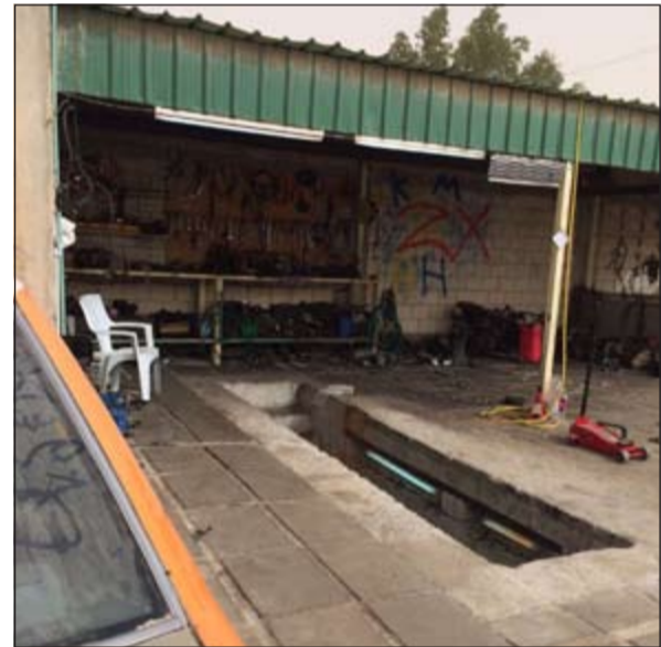
الجواخير تحولت إلى كراجات في غفلة من القانون

دوريات الاسناد برئاسة مدير امن الجهراء اللواء ابراهيم الطراح. هذا، وأسفرت الحملة عن مدهامة 4 جواخير تحولت في غفلة من القانون الى كراجات لتصليح المركبات وعثر بداخل الجواخير الأربعة على جميع الأدوات الخاصة بتصليح المركبات الى جانب