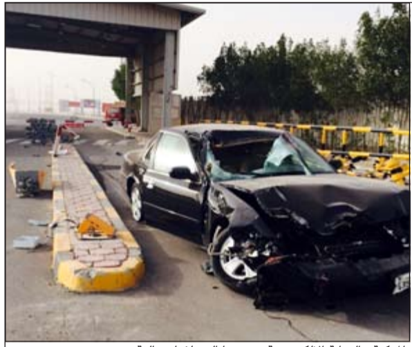
المركبة والبوابة الإلكترونية تعرضتا الى تلفيات بالغة

سجلت قضية اتلاف املاك دولة بحق وكيل ضابط في المباحث الجنائية بعد اصطدامه بشكل عنيف ببوابة الموقع الشمالي التابعة لإدارة العامة لأمن المنشآت، وقال مصدر أمني ان وكيل الضابط (33 عاماً) تم التحفظ عليه وإحالته للتحقيق على خلفية قضية حملت رقم «51/ 2014» مرور الاحمدي، وأكد المصدر على أن كل الإجراءات القانونية تتخذ في مثل هذه النوعية من القضايا، مشيراً إلى أن التحقيقات الأولية تشير إلى أن الحادث نتيجة اختلال عجلة القيادة من يد وكيل الضابط.