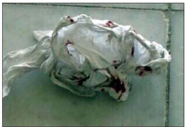
دماء لص تركها على منديل ورقي وهرب