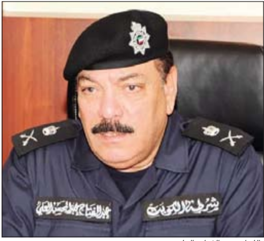
اللواء عبد الفتاح العلي

يحلّ وكيل وزارة الداخلية المساعد لشؤون الأمن العام اللواء عبدالفتاح العلي ضيفاً على ديوان الأكاديميين والكتاب في منطقة الرميثة اليوم وذلك في ندوة حول الأمن العام والشرطة المجتمعية، ووجهت ديوان الأكاديميين الدعوة إلى عسوم أبناء الكويت للالتقاء بالمسؤول عن قطاع الأمن العام اللواء عبدالفتاح العلي وطرح استئلتهم بشأن الأمن في البلاد وطرح مقترحاتهم لتعزيز الأمن، وتعدّد الندوة في السابعة والنصف اليوم السبت في الرميثة في 6 ش شاهين الغانم جادة 64 منزل 88 بجوار جمعية الرميثة وتحديدًا على مقربة من مدرسة عبدالرحمن الغافقي.