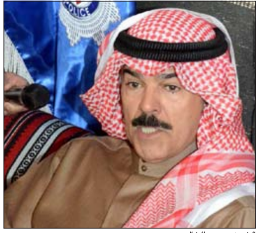
الشيخ محمد الخالد