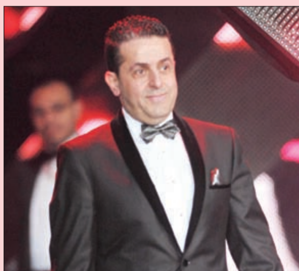
المايسترو إيلي العليا