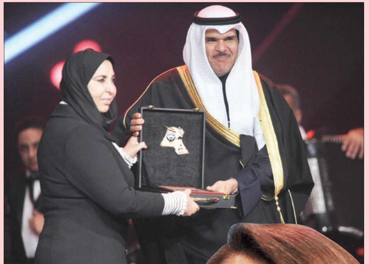
وزير الإعلام والشباب الشيخ سلمان الحمد مكرما الشبخة د.سعاد الصباح

«الأنباء» تكرم الشاعرة الشبخة د. سعاد الصباح بحضور وزير الإعلام والشباب ووزير الدولة لشؤون مجلس الوزراء