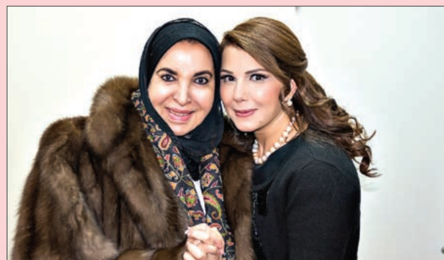
ملك الطرب مع الشبيخة د.سعاد الصباح