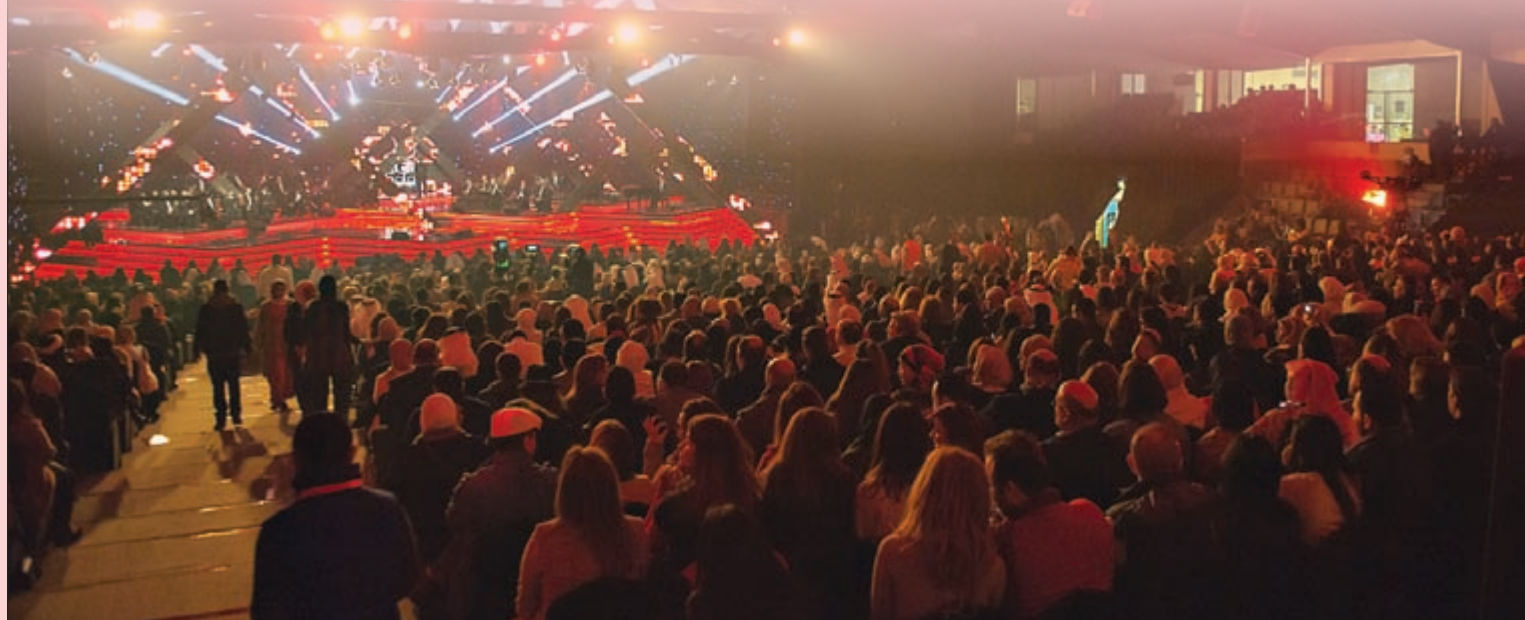
الجمهور الغفير في ليلة السيدة ماجدة الرومي