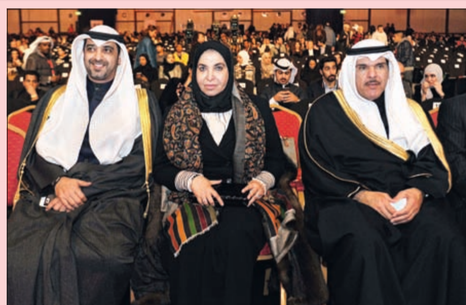
الشبيخة د.سعاد الصباح تتوسط وزير الإعلام (والشباب) الشيخ سلمان الحمود ونجلها الشيخ محمد العبدالله