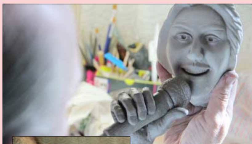
مراحل منحوتة ماجدة الرومي