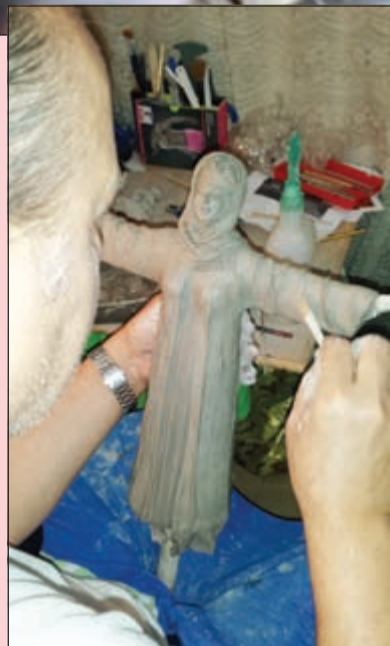
..ومنحوتة الشبيخة د.سعاد الصباح

المنحوتتان مرتا بمراحل عمل طويلة كما هو موضح في الصور، شملت التصميم والنحت لتظهرها بالصورتين اللتين ظهرتا بهما لدى تسليمهما خلال الحفل.