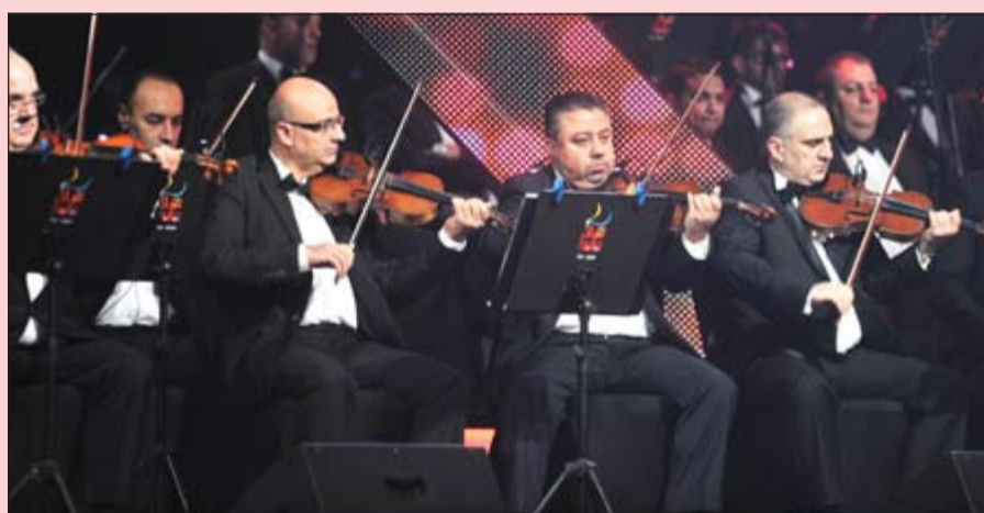
جانب من الفرقة الموسيقية المرافقة لماجدة الرومي خلال الحفل