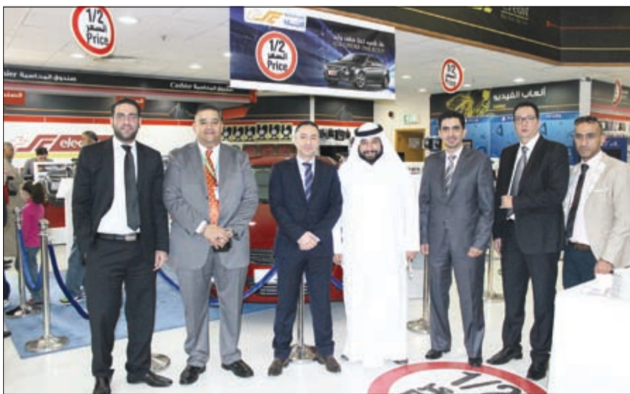
مسؤولو مركز سلطان خلال المؤتمر الصحفي