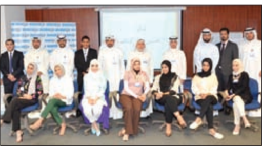
لقطة لبعض المتدربين من موظفي البنك

ضمن إستراتيجيته الهادفة إلى تطوير كوادره مهنية، أتم بنك الكويت الدولي خطته التدريبية للبرامج المصرفية التسريعية لعام 2014، لاثنتي عشرة دورة تدريبية ضمن سلسلة متكاملة من البرامج التدريبية في مجال المصرفية الإسلامية، وكانت ست دورات منها بعنوان «الأساسيات الشرعية للعمل المصرفي الإسلامي ومنتجاته»، وأربع دورات لبرنامج المنتجات المتطورة في المصارف الإسلامية»، ودورتان لبرنامج «صناديق الاستثمار الإسلامي»، ولقد بلغ عدد المتدربين الذين استكملوا متطلبات اجتياز هذه الدورات 253 مشاركاً من موظفي «الدولي»، وفي إشارة إلى هذه الدورات صرح المراقب الشرعي في البنك د. هشام عبدالحى بأن هذه الدورات تميزت بحلقات نقاشية، وحالات عملية شملت معظم نشاطات المصرفية الإسلامية في المجال المصرفي والتمويلي والإستثماري، مضيفاً أن هيئة الفتوى والرقابة الشرعية في بنك الكويت الدولي تولي اهتماماً كبيراً بتدريب كوادرها المعنية في مجال المصرفية الإسلامية، وأن نجاح عقد هذه الدورات يأتي انطلاقاً من حرص «الدولي» على إكساب موظفيه ثقافة مهنية متميزة تؤهلهم لمواكبة التطور المطرد في الصناعة المصرفية الإسلامية، المصاحب للإقبال المتنامي على الخدمات المصرفية الإسلامية.