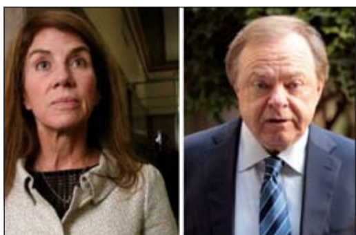
هارولد هام وطليقته آنا أرنال