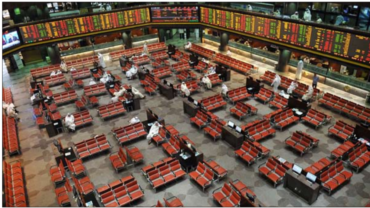
تذبذب شهده المؤشرات العامة خلال الأسبوع الأول من 2015 بسبب موجة الشراء الانتفاهي على أسهم التوزيعات

بنسبة 1,6٪ جراء خسارته 17 نقطة ليستقر عند 1043 نقطة. ● انخفض المؤشر الوزني بنسبة 1,1٪ بخسارته 4,8 نقاط ليستقر عند 434 نقطة. ● تراجع المؤشر السعري بنسبة 0,7٪ على وقع تراجع 44 نقطة بعد الإغلاق عند 6491 نقطة. ● سجلت قيمة التداول الإجمالي للأسبوع تراجعاً لافتاً بنسبة 40٪ مقارنة بالأسبوع الأخير في 2014 حيث بلغت قيمة التداول 100 مليون دينار بمتوسط 20 مليون دينار، وذلك مقارنة بـ 165 مليون دينار بمتوسط 33 مليون دينار.