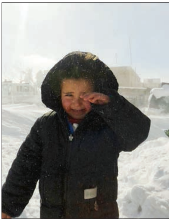
طفلة سورية تبكي من شدة البرد في أحد المخيمات

وكانت مصادر رسمية لبنانية ذكرت أن أربعة سوريين قضاوا جراء الأحوال الجوية السيئة التي تمر بها