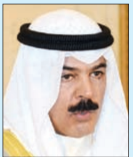
الشيخ محمد الخالد